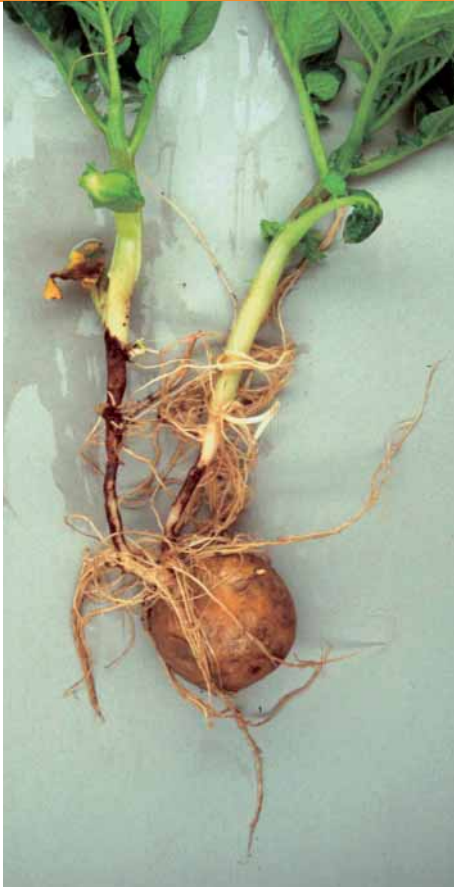
Rhizoctonia solani op stengel

nog geen toelating in Nederland, maar heeft wel een aangetoond effect als knolbehandeling bij het poten. In combinatie met groenrooien is het zeer effectief.