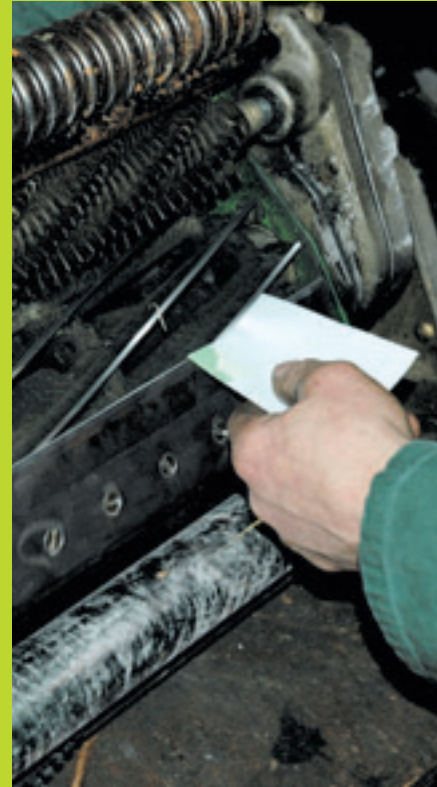
De ultieme test. Een papiertje moet op alle plaatsen in de kooi goed worden afgesneden. Behalve slijpen is afstellen van ondermes en kooi ook een precisie klus.

rondslijpen of ook achterover slijpen. Achterover slijpen is een extra bewerking die ook relatief veel tijd neemt. Op dit moment zetten verschillende klanten van Drost in op alleen rond-