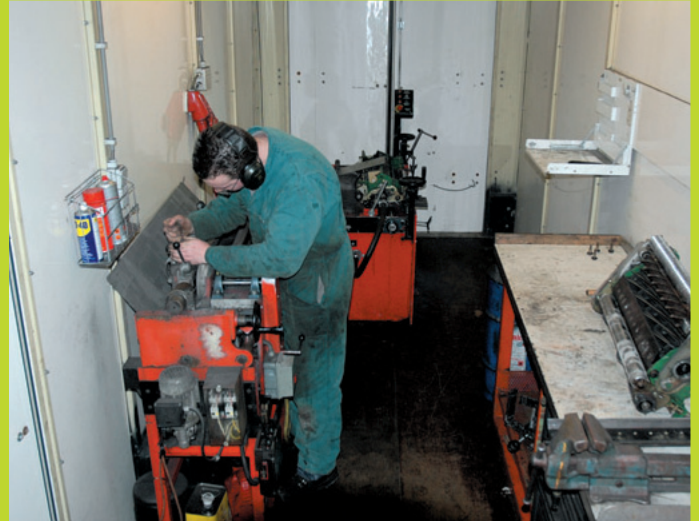
Slijpen op locatie heeft verschillende voordelen. Prijstechnisch is het concurrerend met uitbesteden aan de dealer en in de zomer is een machine maar een minimale tijd buiten gebruik.

Ir. M.C. Smits is freelance-journalist mechanisatie, Biddinghuizen.