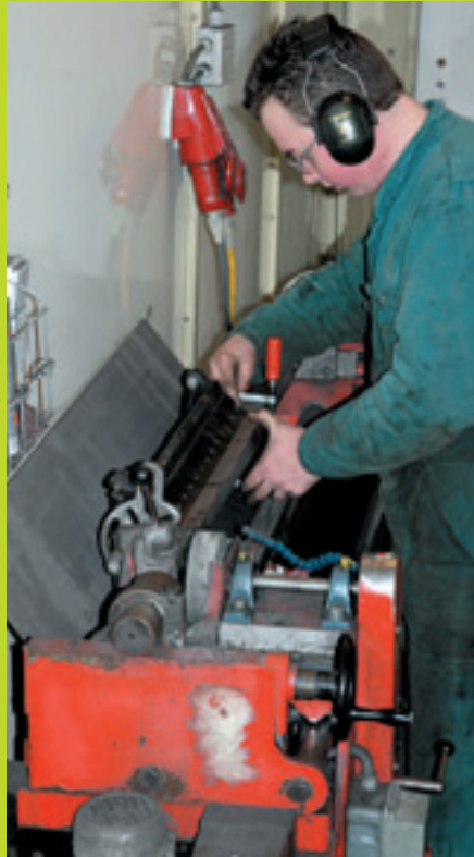
Slijpen is een klus die enige deskundigheid vergt maar waar ook goede en dus vrij prijzige apparatuur voor nodig is. Goed inspannen (links) is de kunst van het slijpen, de rest doet de machine (rechts).