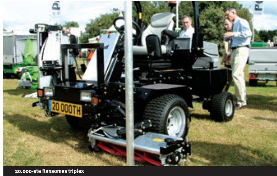
20.000-ste Ransomes triplex

ProGrass toonde een nieuw product voor de biologische bestrijding van plagen en ziekten, namelijk van Pireco uit Ede. Het middel is op basis van sojaolie, knoflook en specifiek werkende kruidenextracten. Hiervan zijn onder andere bij de bestrijding van emelten, engerlingen, rouwvliegen en bij de gevreesde kastanjeziekte goede verwachtingen uitgesproken. De kruiden veranderen de aroma van boom of plant waardoor insecten die specifiek gebonden zijn aan bepaalde boom of plantensoorten wegens gebrek aan voedsel sterven. Pireco Gras moet je in de bodem aanbrengen voor een goede wortelopname, dit kan via een injectiemethode of met een veldspuit waarbij je wel direct moet inregenen. Ook is er nu naast een vloeibare vorm, een granulaat-