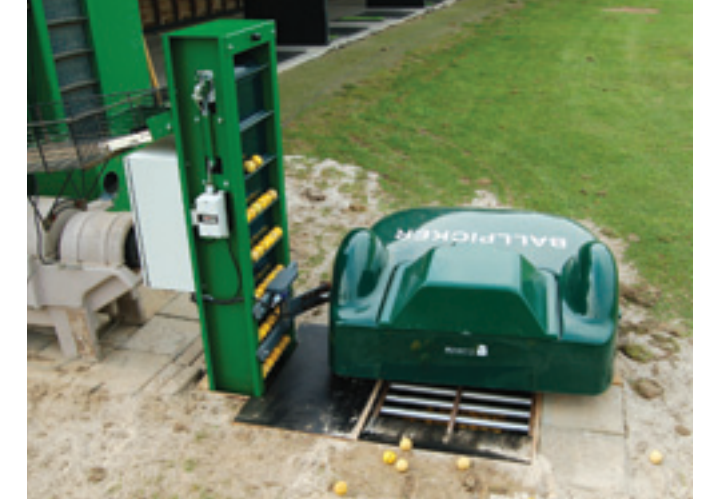
De BigMow maairobot is al wel bekend, maar leverancier Range King heeft ook een vergelijkbare versie als ballenraper voor op de drivingranch. De ballenraaprobot, Ballpicker, zoekt automatisch de golfballen op en deponeert ze in een rooster vanwaar de ballen met een transportbandje omhoog in een mand komen.