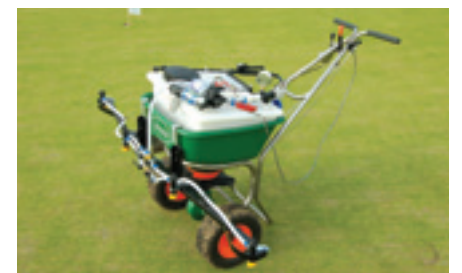
ProGrass presenteerde een Scotts kunstmeststrooier die je kunt ombouwen tot een handveldspuitje. De prijs van de spuitunit komt op circa 1.000 euro excl. BTW.