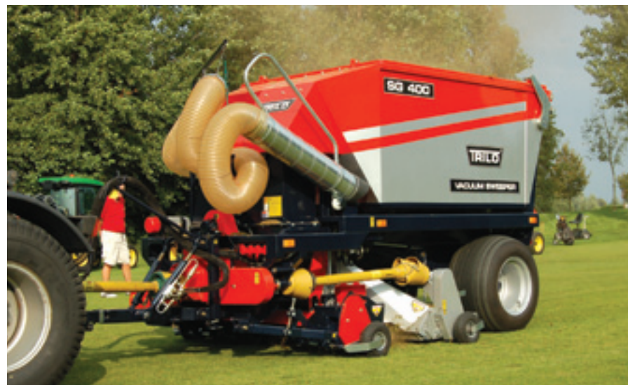
Nieuw op de Trilo veegzuigwagen SG400 zijn verwisselbare tips op de waaiers. Ook nieuw zijn tungsten tips op de verticuteerunit.

N egen holes golfen en negen holes uitrusten. Een uitzonderlijke tentoonstelling. Zo mag je de dag wel noemen die de gezamenlijke ondernemers hadden georganiseerd. De bedrijven hadden op de even holes van golfpark Almkreek hun stand ingericht. Tussendoor speelden de aanwezigen (greenkeepers, NVG- en NGF-leden) de oneven holes. Zo werd er gegolfd, kon men uitrusten, eten en drinken, en bovendien informatie opdoen. Het waren niet zomaar wat demonstraties. De standhouders Heicom, Gebr. Bonenkamp, Louis Nagel, Prograss, Range King, Pols, Trilo, Jean Heybroek, Scotts en Verschoor Groen&Recreatie presenteerden hun nieuwste producten waaronder ook een aantal primeurs. Een impressie.