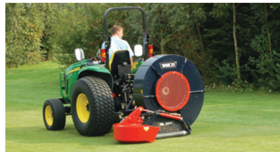
Op de grote Trilo BL960 bladblazer heeft de fabrikant een omkeerinrichting gemaakt. Deze klep kun je hydraulisch vanaf de trekker bedienen. Met heen en weer rijden kun je zo steeds dezelfde kant opblazen.