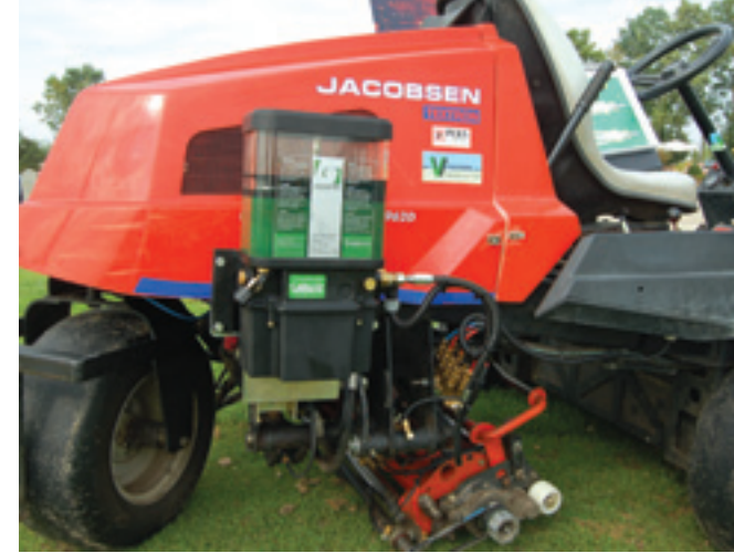
Een greenmaaiër bevat ongeveer 43 smeernippels en als je deze goed wilt langlopen kost je dat 1 minuut per nippel, volgens Groeneveld uit Gorinchem. Het bedrijf levert al jaren automatische smeersystemen en heeft er ook een op een Jacobsen Greensking gemaakt. Dit kost dan wel 2.500 euro, maar het bespaart tijd en je houdt de machine in topconditie meent de leverancier.