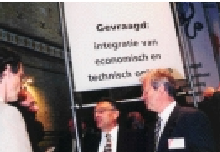
Geanimeerde discussies tijdens de pauze bij de stands.