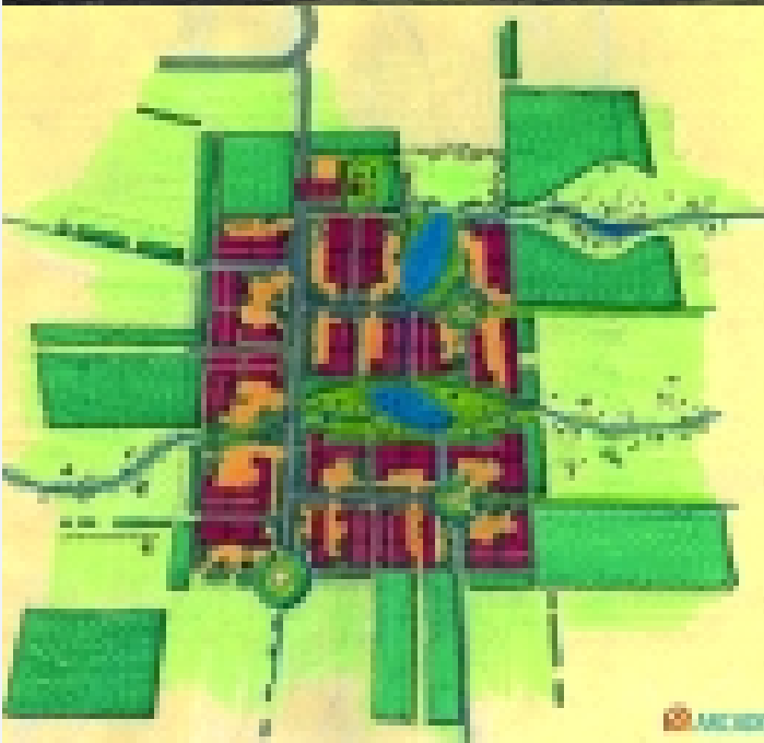
Na herinrichting in agroproductiepark