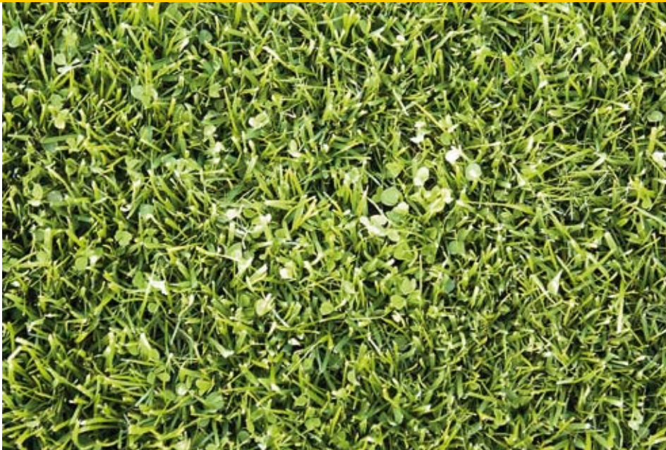
Microklaver in grasmengsels voor greens en sportvelden binden stikstof uit de lucht.