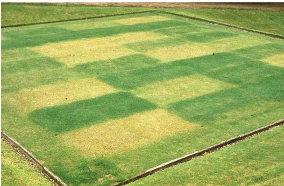
Proefveld bij het STRI: bemesting beïnvloedt kleur en kwaliteit van de grasmat.

stikstofvormen veroorzaken. Er is een duidelijk verschil in de wijze van opname tussen nitraat en ammonium. Nitraat wordt voor een groot deel passief opgenomen en via het xyleem naar het blad getransporteerd. Langs deze weg kunnen grote hoeveelheden stikstof snel worden opgenomen. Dit uit zich vaak in een weelderige groei van gras met vooral lengtegroei. Ammoniumopname is vooral een actief proces waarbij het ammonium in de wortel meteen in aminozuren wordt omgezet om de plant niet te vergifigen. Dit kost energie. Nitraatassimilatie kost 12 ATP per molecuul N,