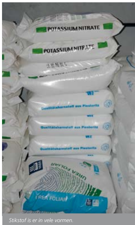
Stikstof is er in vele vormen.

Stikstof kan worden toegediend via diverse enkelvoudige en samengestelde meststoffen. Let daarbij niet alleen op het N-totaal gehalte van de meststof maar ook op de verschillende N-vormen. Zo bevat kalkammonsalpeter zowel nitraat als ammonium; bevat zwavelzure ammoniak uitsluitend ammonium en bevat vaste kalksalpeter weinig nitraat. Naast nitraat en ammonium