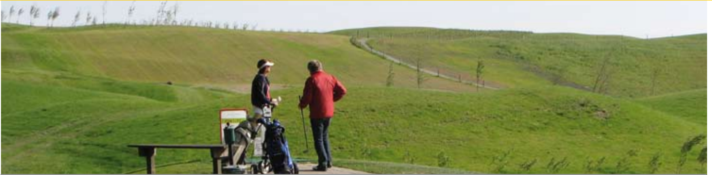
Zicht op De Terp vanaf de 9-holes par 3.