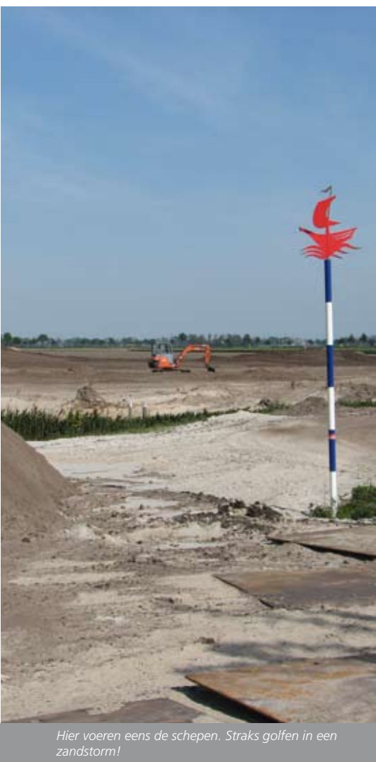
Hier voeren eens de schepen. Straks golfen in een zandstorm!

voorzien. Tenslotte kan gras voor een goede beginontwikkeling niet zonder voedingsstoffen en hebben we gelukkig de expertise nog om handmatig kunstmest te strooien!”