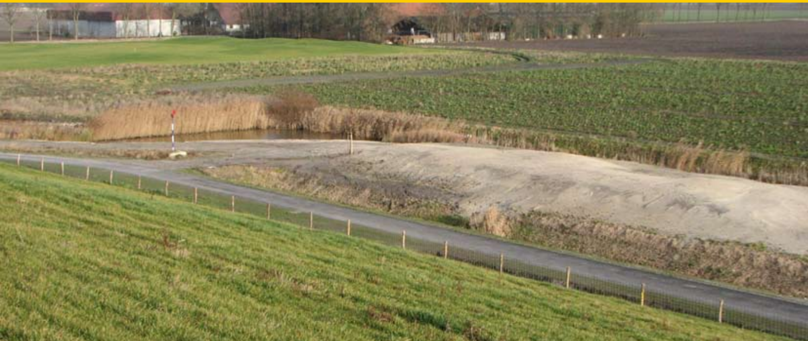
Het perceel grond achter een ecologische zone ligt gereed voor de aanleg van de laatste drie holes (situatie in februari).