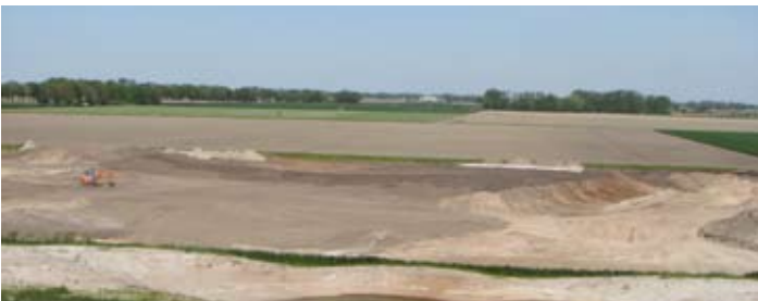
Aannemer Heijmans is in april gestart met de laatste fase van de aanleg.