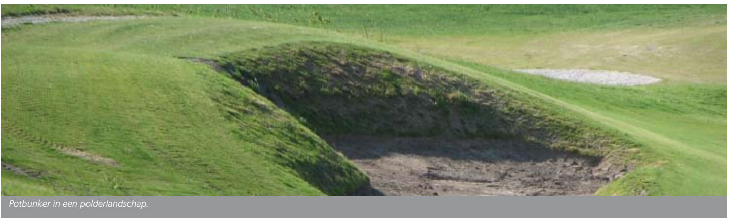
Potbunker in een polderlandschap.