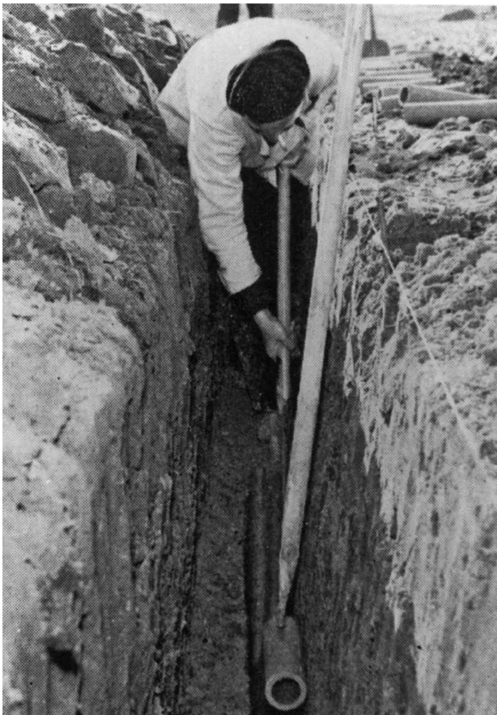
Figuur 5: Het leggen van de drainbuizen volgens de 'Groninger methode'.