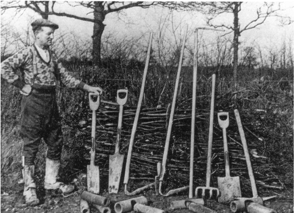
Figuur 6: Handgereedschap voor het graven van de drainsleuven en het leggen van drainbuizen (Foto uit: Harvey, 1956).

Volgens Ten Rodengate Marissen (1920) was in 1900 in ons land 53.567 hectare, voornamelijk bouwland, gedraineerd, waarvan 39.218 hectare ofwel 73% van het totaal in Groningen. In Zeeland bedroeg het aantal hectare 8.002, in Friesland 2.010, in Noord Holland 1.994 en in Noordbrabant 947 hectare. In Gelderland was 473, in Zuidholland 433, in Limburg 401, in Utrecht 72, in Overijssel 10 en in Drenthe slechts 7 hectare van drainbuizen voorzien.