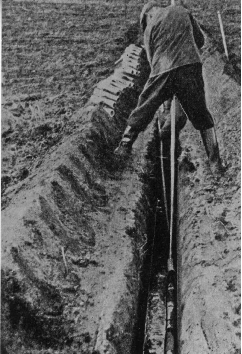
Figuur 7: Het leggen van drainbuizen volgens de 'Zeeuwse methode'.