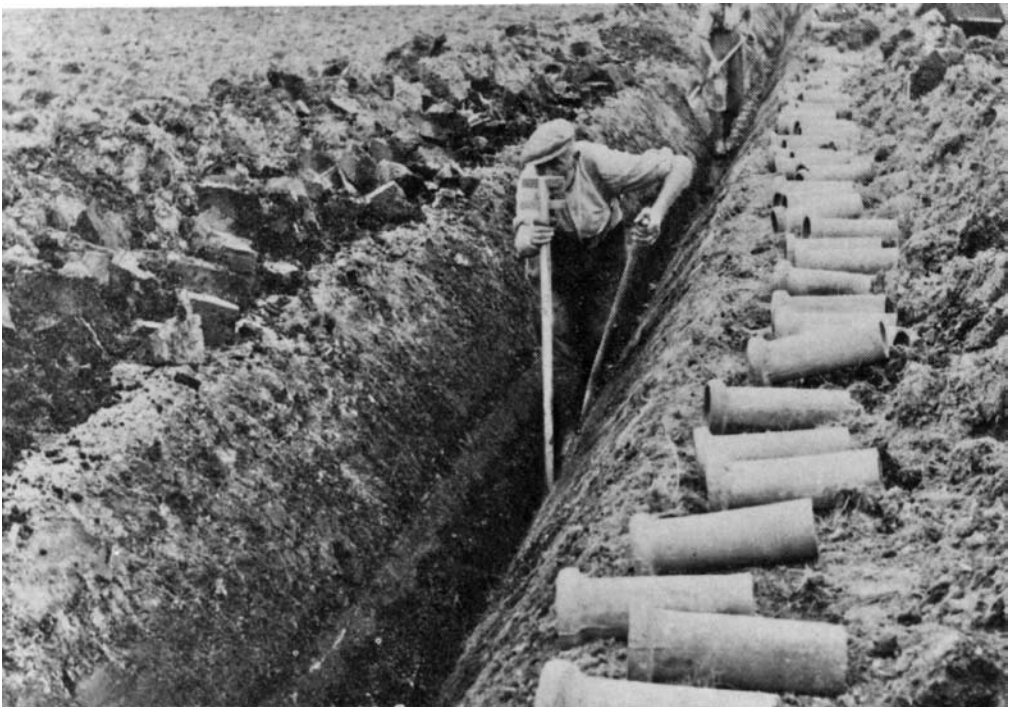
Figuur 4: Zichten van het verhang in de drainsleuf.