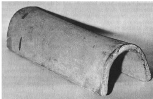
Figuur 1: Voorbeeld van een hoefijzervormige drain die omstreeks 1835 door een pottenbakker werd vervaardigd.

kerken. Deze 'horse shoe', ofwel 'hoefijzervormige' drains, werden in stevige gronden ook wel zonder tegel gelegd (figuur 1).