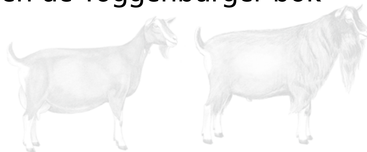
Links Toggenburger geit en rechts Toggenburger bok.

De Nederlandse Organisatie voor de Geitenfokkerij (NOG) heeft in samenspraak met de fokcommissies van elk geitenras een True Type tekening laten maken. Het True Type is het beeld van de geit of bok dat een fokker voor ogen dient te hebben. Het derde ras in de serie is de Toggenburger.