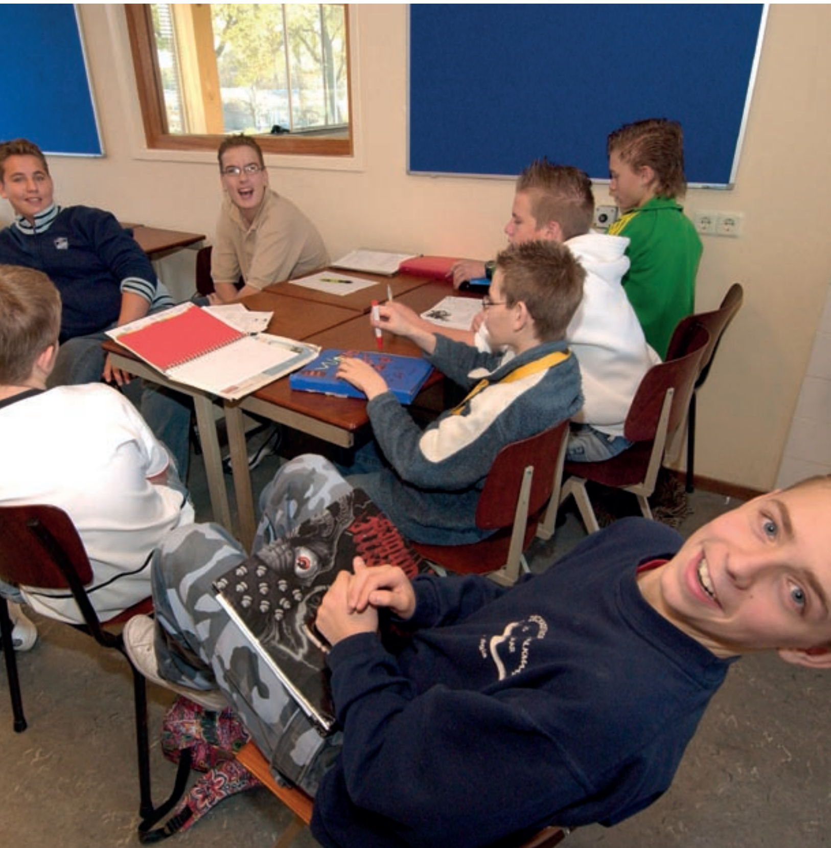
Jongeren brengen hun eigen jeugdcultuur de school binnen. Die cultuur botst soms met de schoolcultuur. Een school kan helpen die jeugdcultuur te doorbreken