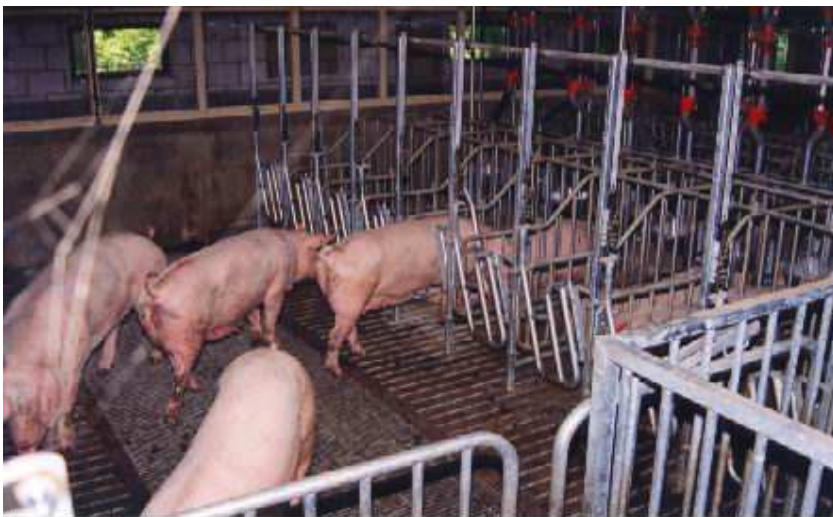
Foto 1 Voerligboxen met uitloop

Vanaf 2013 moeten alle dragende zeugen in Nederland in groepshuisvesting worden gehouden. Het omschakelingsproces is sinds begin 2003 al aan de gang. Toen startten veel zeugenhouders met voerstation en strobed. De tendens nu is dat er steeds meer voerligboxen met uitloop worden gebouwd. In opdracht van het Ministerie van LNV hebben LEI en ASG (Wageningen UR) onderzoek gedaan naar de stand van zaken rond groepshuisvesting van zeugen. Er is gebruik gemaakt van voorlopige cijfers van de landbouwtelling van 2008. Hierin is gevraagd naar huisvestingssystemen bij zeugenhouders. Bovendien is een (representatieve) telefonische enquête uitgevoerd door Agridirect met aanvullende vragen, onder zeugenhouders met minstens 100 zeugen. De resultaten geven de situatie per voorjaar/zomer 2008.