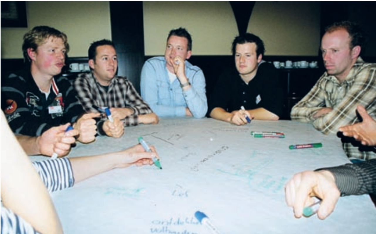
Ondernemerskwaliteiten in beeld, de eerste grote workshop waarbij kernbegrippen rond ondernemen op een tafelkleed werden geschreven

maken: word ik ondernemer of niet? Past dat wel bij mij? Wat zijn mijn kwaliteiten en capaciteiten? Jongeren willen na het onderwijs weten wat je moet doen om een goede ondernemer te worden. Op school doen studenten vooral theoretische, algemene kennis op over het ondernemerschap. Na school rijzen de vragen: Hoe ga je om met personeel? Wat doe ik bij ruimtelijke ontwikkelingsprocedures? Dergelijke onderwerpen zijn onderbelicht in het groene onderwijs. Het zijn persoonlijke, op de eigen situatie toegespitste vragen waar wij jongeren graag bij helpen door middel van ons coachingsprogramma. Wij begeleiden jongeren, leren ze welke stappen ze moeten nemen in het ondernemerschap en waarmee ze rekening moeten houden. Met als doel het ondernemerschap bij afgestudeerden te ontwikkelen en stimuleren.”