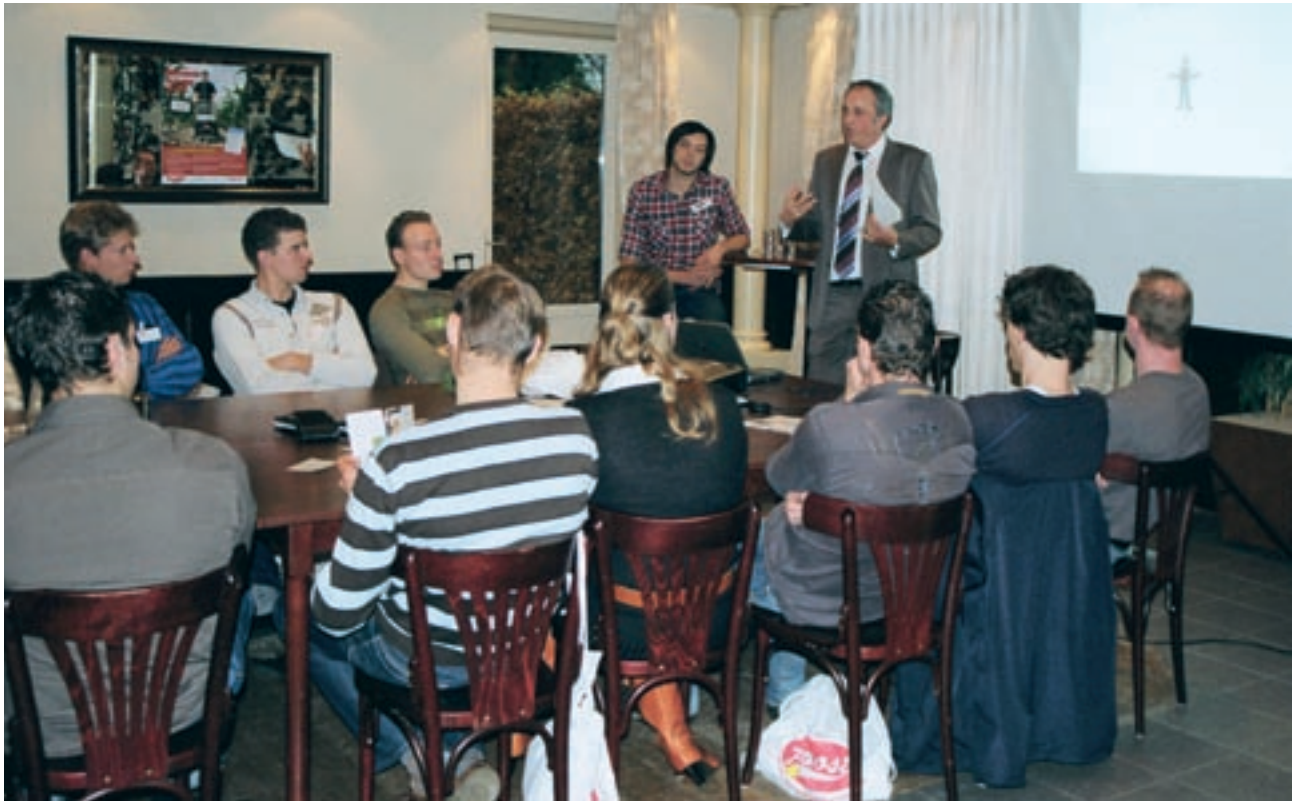
De Rabobank verzorgde ook een workshop en vertelde waaraan potentiële bedrijfsopvolgers moeten denken wanneer ze het bedrijf van hun ouders overnemen

onderwijs. Toen mijn vader wethouder werd, wilde ik het bedrijf overnemen. Ik wilde dat al vanaf mijn jeugd. Op de HAS leerde ik vaardigheden die je nodig hebt voor een eigen bedrijf. Je krijgt er de ruimte je te ontwikkelen als ondernemer. We deden rollenspellen om te leren communiceren. En we gaven boeren adviezen over problemen uit de praktijk. Door zulke projecten en de stages werden we geprikkeld verder te kijken dan wat de opleiding biedt.