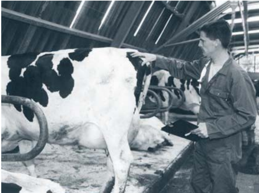
Regelmatig de conditie van de koeien scoren leidt tot betere resultaten.

De optimale conditie voor een bepaald lactatiestadium of een bepaalde droogstand moet zijn gebaseerd op resultaten van wetenschappelijk onderzoek. Helaas zijn momenteel nog slechts beperkt resultaten beschikbaar. Met name de conditie bij afkalven is van wezenlijk belang voor een gezonde start van de nieuwe lactatie. Een te schrale conditie bij afkalven gaat ten koste van de melkproductie. Een overmatige conditie leidt tot ziekte- en vruchtbaarheidsproblemen.