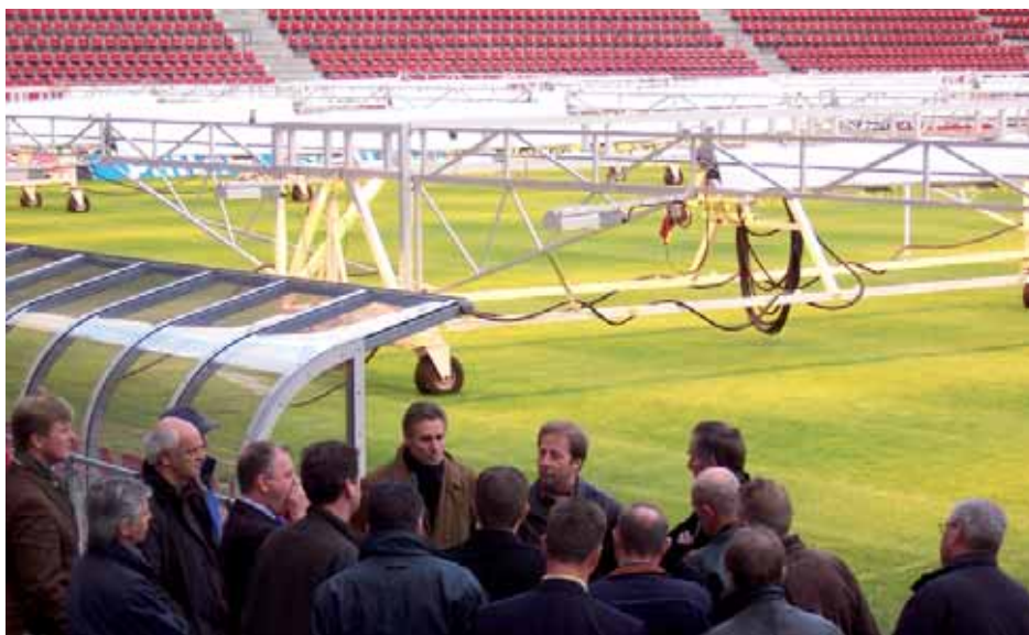
In 2005 organiseerde HAS kennistransfer een bijeenkomst in het PSV stadion waar onder andere gesproken werd over een nieuwe opleiding tot sportveldmanager.

Het is van belang dat de grasveldenmanager het vermogen heeft om te communiceren naar de eindgebruikers en naar de opdrachtgever. Communicatie is een competentie die deels aangeleerd kan worden en deels aangeboren moet zijn. Enerzijds is het de verantwoordelijkheid van de fieldmanager om communicatievaardigheden te ontwikkelen en zich te laten horen, niet klagen maar assertief vragen! Anderzijds is het de verantwoordelijkheid van zijn leidinggevende om de fieldmanager aan te spreken op zijn verantwoordelijkheid en hem op de hoogte te houden van de actuele ontwikkelingen. Zij moeten streven naar samenwerking en goed overleg, 'elkaar de bal toespelen'. "Het is belangrijk dat scholing mogelijk is voor alle lagen van het team. Communicatietraining