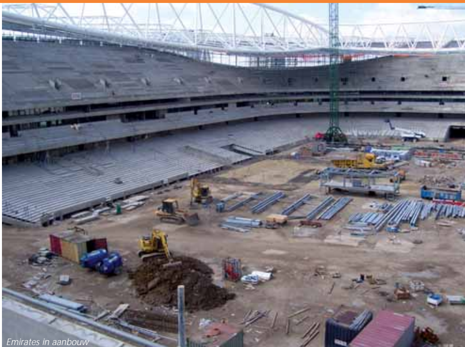
Emirates in aanbouw