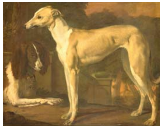
Portret van een staande windhond en een liggende patrijshond, Jan Weenix

In het standaardboek over de jacht in Nederland door J.H. Dam (Het jachtbedrijf in Nederland en West-Europa) uit 1954 wordt overigens niet gesteld dat de Friese windhond uitgestorven is, maar dat de lange jacht met deze hond niet meer mag worden uitgevoerd. In J. Dams boekje Hondenrassen Beeld-encyclopedie uit 1956 staat bij nummer 89 de hiernaast afgebeelde 'windhond'.