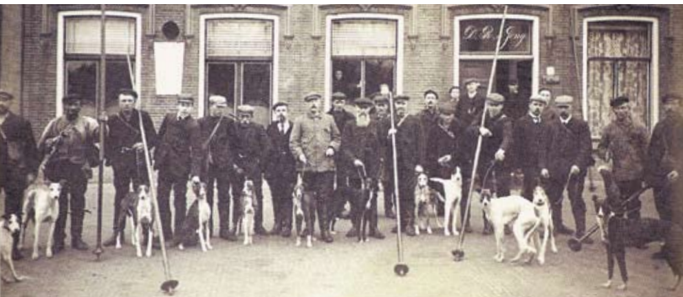
Jagers met hun windhonden staan klaar voor een lange jacht

Geïnteresseerde lezers kunnen hierover contact ook opnemen met: rene.zanderink@reedbusiness.nl