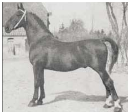
Nubert (1926 -1945)

In de eerste helft van de negentiende eeuw begon de warmbloedpaardenfokkerij weer enigszins op te krabbelen uit het dal dat