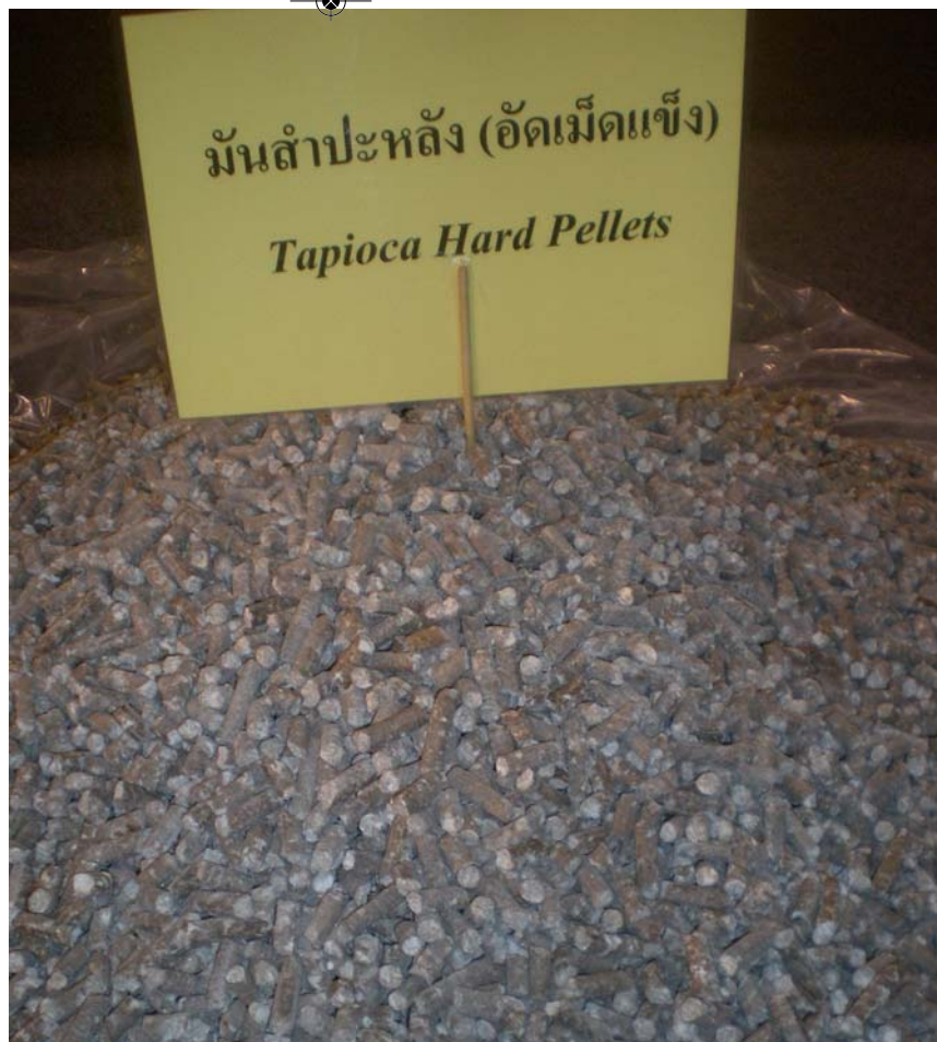
Europa importeert vooral tapioca in pelletvorm. Momenteel is de import van tapioca in Europa beperkt door de prijs ervan.