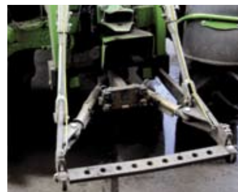
▲ Volgens specificaties kan de hef 4.300 kg tillen. De achterbrug is verder standaard uitgerust met twee dubbelwerkende ventielen.