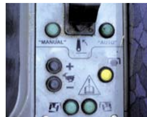
▲ Naast de bestuurdersstoel zit de handbediening van de hef, aftakas, rijnsnelheid en de scheefstelling.