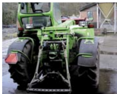
▲ Doordat de giek erg laag geplaatst is, heeft de bestuurder veel overzicht. Het overzicht op de achterbrug valt tegen.

machine diverse verbeteringen zijn geweest op allerlei gebieden. De motor krijgt een vermogen tot 88 kW (120 pk). De bediening is op onderdelen aangepast en ook het lakwerk is verbeterd. Afgelopen jaar is een nieuw model geïntroduceerd op basis van een kleinere verreiker. In de toekomst zal ook een nog een groter model op de markt komen.