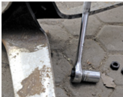
▲ Bij het losdraaien van moeren van cultivator-tanden maakte WD-40 de beste indruk.

koolzuurhoudend water en bevatten cola-extract ofwel cafeïne. Daarnaast zitten er eiwitten, koolhydraten (suikers), vet, vezels en voedingszuren in. Het enig aantoonbare verschil tussen Coca-Cola en Pepsi-Cola is volgens de etiketten de aanwezigheid van een heel klein beetje natrium (0,002 gram per 100 ml) in de Pepsi. Om als serieus roestwerend of oplossend middel te kunnen dienen, is het gebruik van een plantspuit of iets dergelijks aan te bevelen, anders zijn lastige gelegene knelpunten niet bereikbaar.