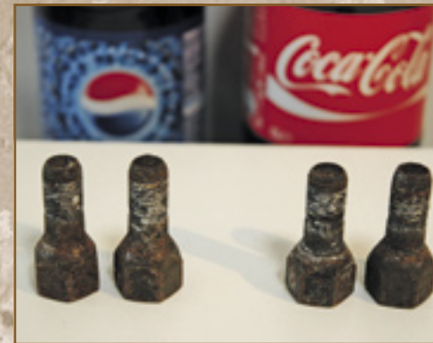
▲ Vier aangetaste wielbouten gingen twee aan twee in een glas met Pepsi-Cola en een glas met Coca-Cola.