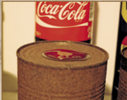
▲ De cola's blijven gewoon op hun plek liggen en vloeien niet uit. Ook vertonen ze geen tekenen van hechting aan het metaal.