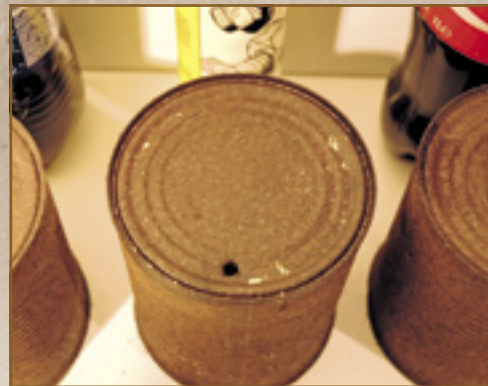
▲ De kruipolie van Kroon slaagde er als enige in wat blanke plekkjes te maken op de bodem van het conservenblik.