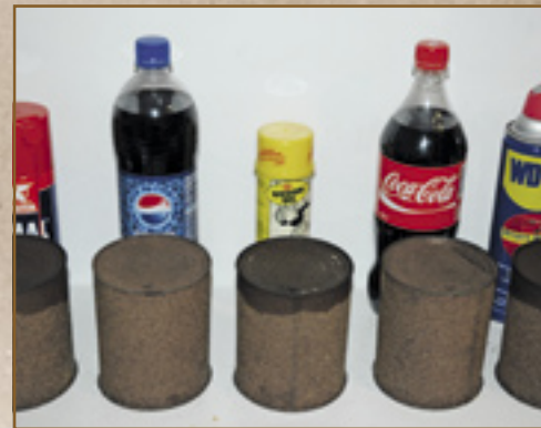
▲ Imal en WD-40 vloeien snel uit. De vette kruipolie van Kroon doet daar wat langer over, maar komt uiteindelijk net zover.