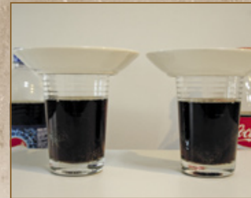
▲ Na een week in de cola bij 15 graden Celsius bleek de corrosie op de bouten enkel nat maar niet opgelost.

wat groezelig uit gaat zien en steeds vettiger aan gaat voelen. Kroon-oil is een grote zelfstandige fabrikant van smeermiddelen en gevestigd in Almelo. We betaalden 5,49 euro voor een bus van 300 ml.