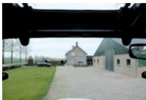
▲ De dakrand ligt vrij laag, maar het normale rondomzicht ondervindt daar geen hinder van.