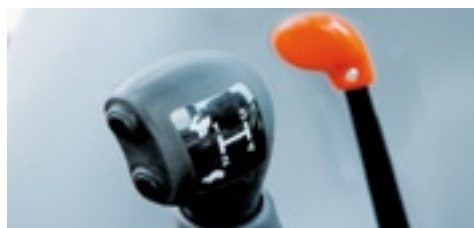
▲ De pook herbergt vier gesynchroniseerde versnellingen en een belast schakelbare hoog-laag.