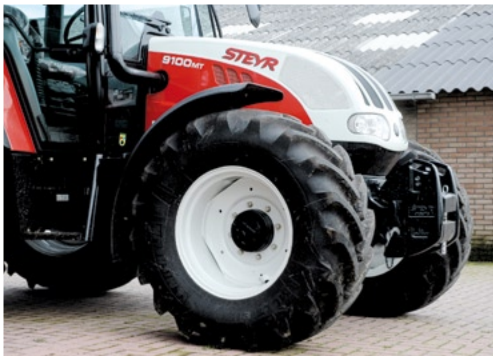
▲ De 9100 MT kreeg ten opzichte van z'n voorganger 9100 M onder andere een 25 cm langere neus en een zwaardere vooras. De opvolger 9105 MT, die binnenkort komt, heeft een Stage 3 motor.