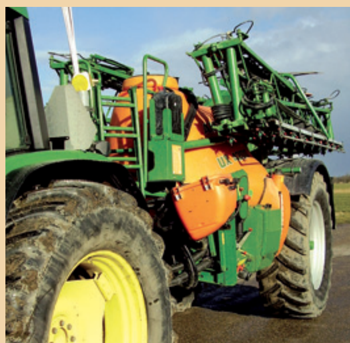
In transportstand worden de Super-L-spuitboomsegmenten naast het smalle gedeelte van de tank ingeklapt met een totale transportbreedte van 2,60 meter.