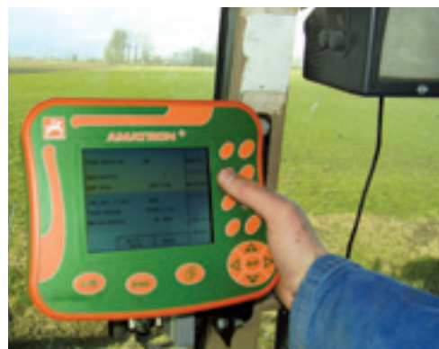
De boordcomputer biedt veel mogelijkheden en is te verplaatsen naar een andere trekker. Bediening met tiptoetsen vergt in de praktijk enige gewenning.