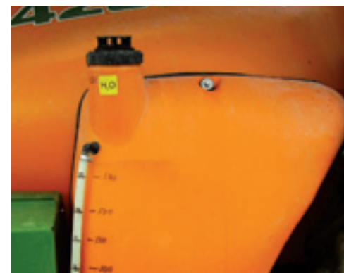
Aan de zijkanten van de tank zitten twee schoonwatertanks met een totale inhoud van 520 l en een kleinere tank voor persoonlijke verzorging zoals handen wassen.