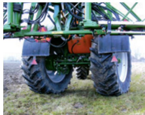
Fuseebesturing zorgt voor een rustig gedrag van de spuitboom en grote stabiliteit, vooral bij het nemen van scherpe bochten. De wendbaarheid, vooral bij het achteruitrijden, is uitstekend.