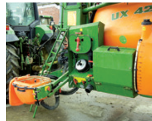
Foutieve bediening van de keuzekranen en hendels wordt voorkomen door het overzichtelijk en ergonomisch bedieningspaneel als centrale schakeleenheid.