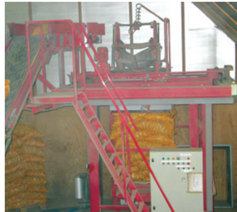
Na het verpakken van het product worden de zakken bij Gilles Boer naar de palletiseerder getransporteerd.