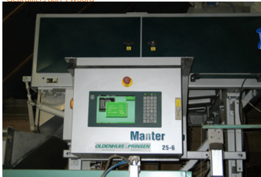
De hele machine kun je bedienen en instellen via deze overzichtelijke computer.

De heer Boer heeft een akkerbouwbedrijf met een omvang van 72 ha in Bant. De geteelde gewassen zijn onder meer pootaardappelen, suikerbieten, winter-tarwe en zaai-uien. De grondsoort is lichte klei. Vier jaar geleden schafte hij een Manter 25-6 weegmachine aan.