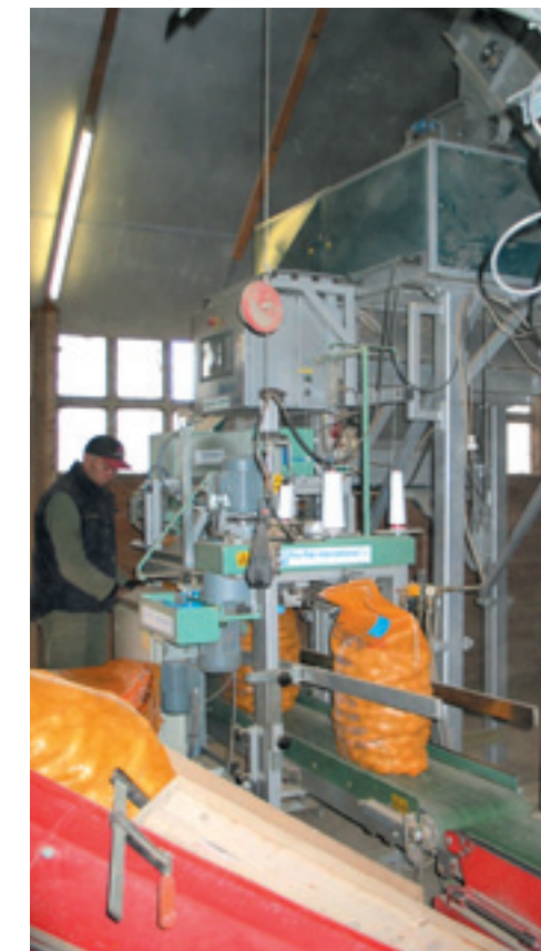
De gewenste snelheid van de weger en de verpakker is mede afhankelijk van de snelheid van de palletiseerder.