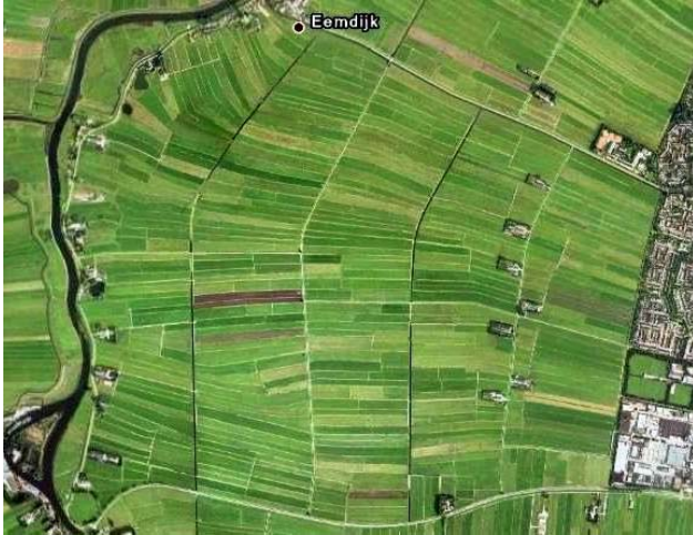
Kernkwaliteiten in slagenverkaveling (Eemland, links) en onregelmatige verkaveling door oude krekken (Arkemheen, rechts)