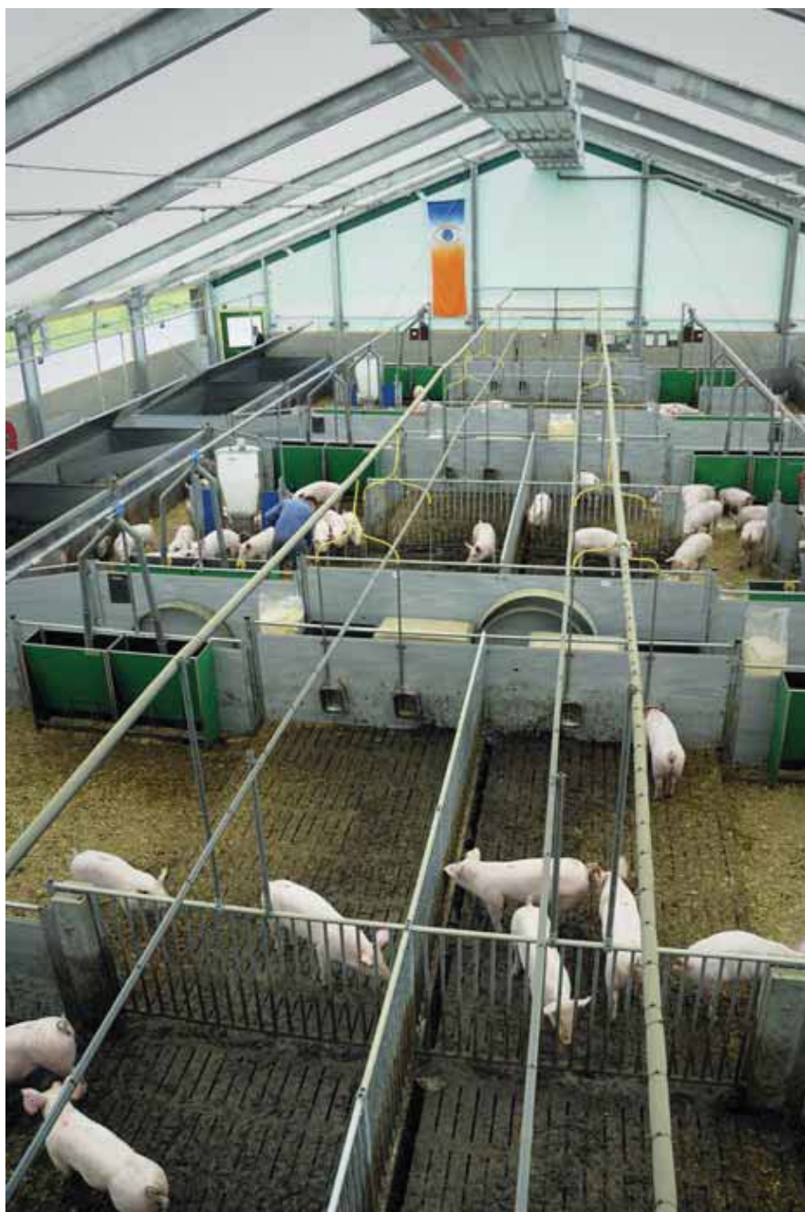
Varkensonderzoek in Raalte staat op de nominatie te verdwijnen.

terug. De enige optie voor Aver Heino is: inzetten op onderzoek voor multifunctionele landbouw en plattelandsontwikkeling.