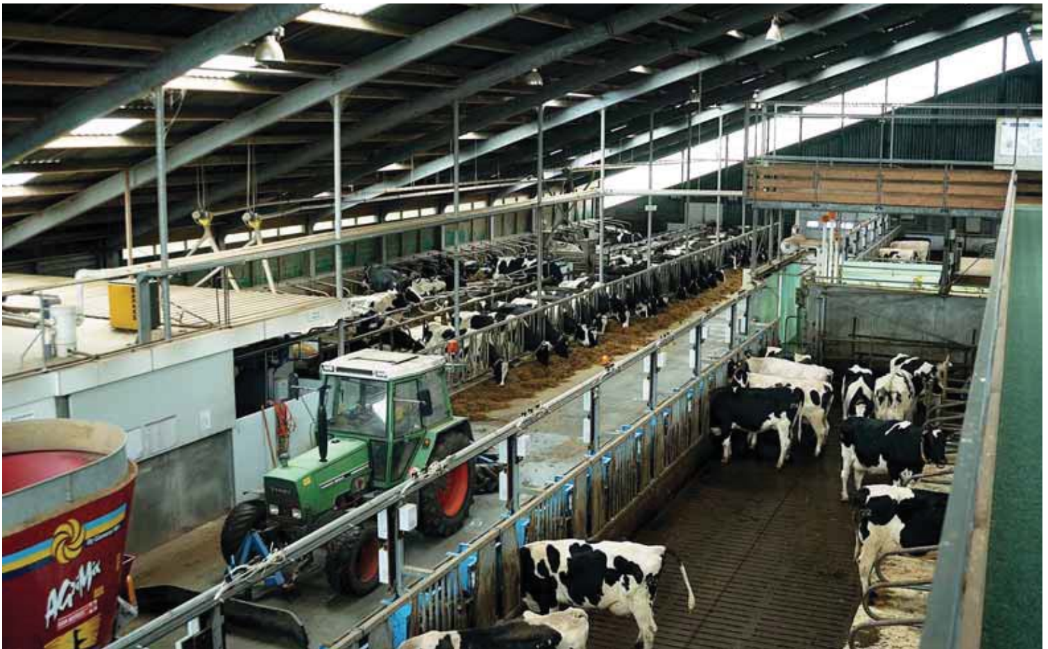
De Nij Bosma Zathe bij Leeuwarden wordt uitgebouwd tot Nij Waiboerhoeve, hét praktijkcentrum voor de melkveehouderij.