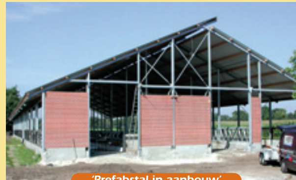
'Prefabstal in aanbouw'

In de Prins Johan Frisoal valt meteen de grote stal in de stand van Brouwers Equipment op. Bouwbedrijf Van de Veer ontwikkelde namelijk een prefabstal die vaste stramienmaten en een flexibele indeling kent. Allereerst worden de poeren aan de hand van een computerberekening in de grond gezet. Daartussen worden alle elementen geplaatst. De onderbouw moet dan ook binnen een dag staan. Daarna worden de metalen spanten met hun houten of ijzeren gordingen geplaatst en volgt ook het dak, zodat het casco binnen een tot twee weken staat. Vervolgens komt de inrichting van de stal aan de beurt. De stal heeft een dichte gestorte of prefab-vloer en dus geen mestkelder. De mest gaat met een schuif naar de mestput erachter. Vijf tot zes weken na het begin van de bouw is de hele stal gereed. De kosten zouden volgens bouwbedrijf