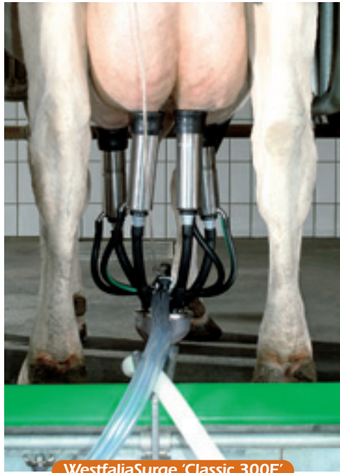
WestfaliaSurge 'Classic 300E'

doseerpompen maar een derde voor automatische desinfectie, is mogelijk. Doordat het warme water van buiten de machine in gaat kun je dus zelf kiezen welke warmtebron het meest geschikt is, gas, elektrisch of wellicht olie. Omdat de afstand tussen de spenen van de achterste kwartieren van de koeien de afgelopen tijd kleiner is geworden heeft WestfaliaSurge een nieuwe tepelvoering gemaakt; de Classic 300E . De aansluitpijpjes van de korte melkslang van de achterste kwartieren staan dicht bij elkaar. Zo blijven ze flexibel en hangt de melkbeker recht. Verder laat RMS de nieuwe Titan melkrobot zien en toont Fullwood een leuke herkenningstechniek. Het heet Watch ID en wordt vooralsnog alleen bij geiten toegepast. De melker draagt een polsband waarin een chip is verwerkt. Zodra hij de automatische afname activeert registreert de monitor, waarin ook een chip zit, dat. Vervolgens pakt de