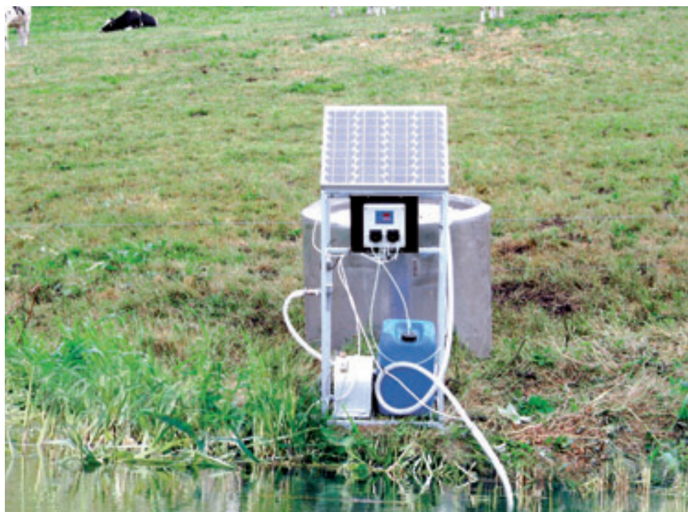
Calvex bedacht een pompje waarmee je nu ook in de wei mineralen kunt toevoegen aan het drinkwater.

Wel eens een hek open laten staan of een schrikdraadje niet afgesloten? Of last van een kapotte draad. Met de Gallagher SmartWatch kom je er snel genoeg achter. Zodra het apparaat namelijk een onderbreking van de stroom van de schrikdraadomheining opmerkt, stuurt het een sms-bericht naar de telefoon van de veehouder. Het apparaat krijgt zijn stroom van de zon en heeft een batterij als reserve. ■