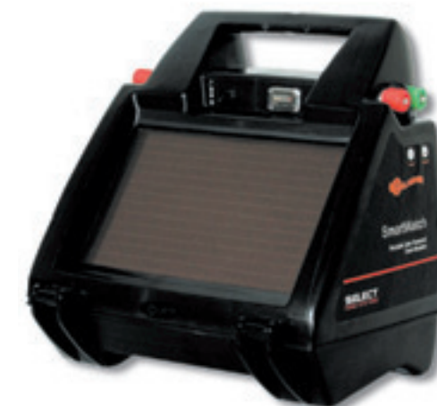
De Gallagher SmartWatch.

Calvex bedacht een systeem om koeien in de wei ook water te kunnen laten drinken met toegevoegde mineralen, aminozuren en vitaminen. Het wordt door zonne-energie aangedreven en pompt slootwater in een drinkbak en voegt tegelijkertijd mineralen en vitaminen toe. Je moet wel eerst even ingeven hoeveel er dagelijks bij het water moet.