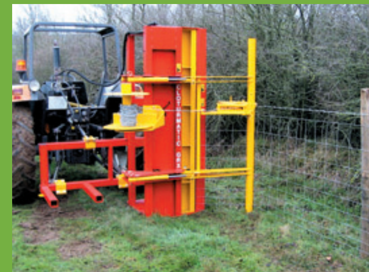
Het driepunts afrasteringsmachientje van Rabaud maakt het mogelijk om met één man een afrastering te plaatsen en af te breken.

Wie nog prikkeldraad gebruikt, weet het. Nieuwe omheiningen aanleggen maar zeker verwijderen, is een vervelend karweitje. Rabaud bedacht er een driepunts apparaatje voor. Het rolt 1 of 2 rijen prikkeldraad in één keer op of af. De bestuurder moet de draad strak houden terwijl een rem hem daar een handje bij helpt. Doordat de draad dus altijd strak staat, kan de bestuurder van de trekker ook de krammen in de paal slaan. En daar ligt meteen het grote voordeel van de machine. Eén man kan nu het werk doen. ■