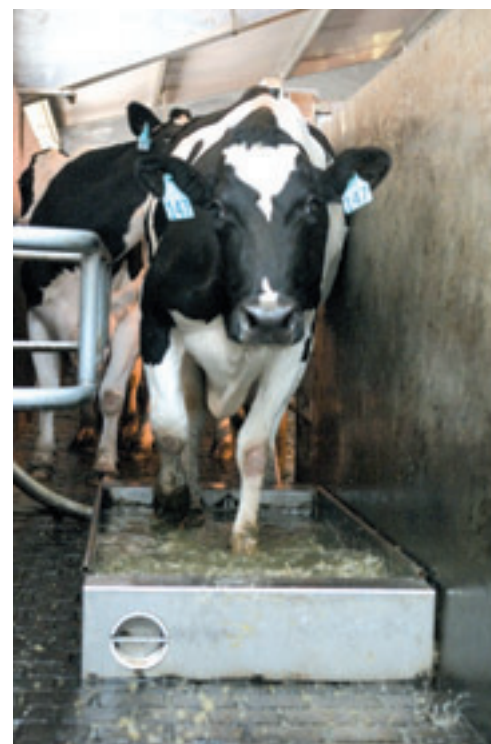
Het hoefbad van DeLaval loopt automatisch op vastgestelde tijden leeg en weer vol.