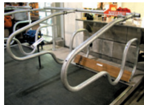
De R-flex van Brouwers is een flexibele ligboxafschijder.

De eerste keer dat AgroVak in de Bossche Brabanthallen vorig jaar december werd georganiseerd bleek een succes. Ruim 38.000 bezoekers togen naar Brabant, evenveel als vorige keer naar Zuidlaren, maar zeker 20.000 minder dan naar de LandbouwRAI in Amsterdam. Een echte regiobeurs dus.