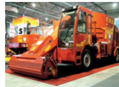
De RMH VSL16.

Last van vogels bij het voer voor de koeien in de stal? Dat is op te lossen. Met de BirGard van IdeeAGro bijvoorbeeld. Het apparaat verjaagt vogels met angstgeluiden van natuurlijke vijanden van de vogels die je wilt verjagen. De tijd waarop de geluiden worden afgespeeld is in te stellen. Tegelijkertijd kan het verschillende geluiden door elkaar afspelen, zodat de vogels niet aan een geluid wennen. Het is ook uitbreidbaar, zodat je meer speakers en geluidchips kunt plaatsen en er is zelfs een zonnepaneel leverbaar zodat het apparaat niet op het lichtnet aangesloten hoeft te worden. De goed-