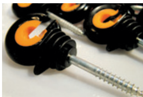
De Gallagher XDI moet vooral steviger zijn, doordat de ijzeren kern helemaal doorloopt.

▪ Inkuilmiddel toevoegen aan balen Baler's Choice toonde in Londen een systeem-pje waarmee conserveringsmiddelen aan balen kuilgras toegevoegd kunnen worden. Het gaat om een gebufferde vorm van propionzuur die het gras een pH van 6 moeten meegeven. Daardoor is het ook niet erg schadelijk voor het metaal van de pers.