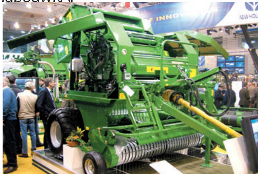
De Ierse fabrikant McHale heeft de oprolpers uit de Fusion perswikkelcombinatie gehaald en verkoopt hem nu onder naam F550.

Het zuur zit in een tank op de pers en wordt continu over het gras gespoten vlak voor de opraper in een dosering van 1,9 tot 7,4 liter per ton, afhankelijk van het vochtpercentage van het gras. De computer meet vijf keer per seconde hoe droog het gewas is. Komt er geen gras in de machine, dan ziet een infrarood oog dat en stopt de pomp. Het aanraakscherm in