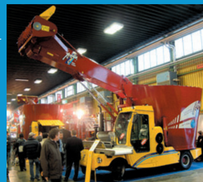
De transportband van de AGM Virage loopt voor de cabine langs. Het verbeterd het zicht op het voeren.

De AGM zelfrijdende voermengwagen Virage laadt zich met de grote freesarm, mengt met een verticale vijzel en brengt het voer via een transportband langs de cabine naar voren. Daar komt het mengsel op een dwarsband die voor de cabine langs gaat. Daardoor heb je goed zicht op het voeren, ook in U-stallen. Er zijn vijf typen, met een bakinhoud van 10 tot 20 m 3 . De kleinste heeft een 93 kW (125 pk) John Deere viercilinder en de grootste een 127 kW (170 pk) John Deere zescilinder dieselmotor. De machines zijn ook te krijgen met een afvoerband achter de cabine. Deze compactere serie heet de Vantage. Deze zijn wendbaarder met een wielbasis van 236 cm voor de kleinste en 253 cm voor de twee grootste. Bij de Virage is wielbasis respectievelijk 309 en 330 cm. Ook nieuw is de Gallignani Speedliner, een combinatie van een oprolpers met een wikkelaar. Opvallend bij deze combinatie is de zorg voor het grasbestand. Tijdens het draaien wordt automatisch de achterste as van het tandemstel geheven. ■