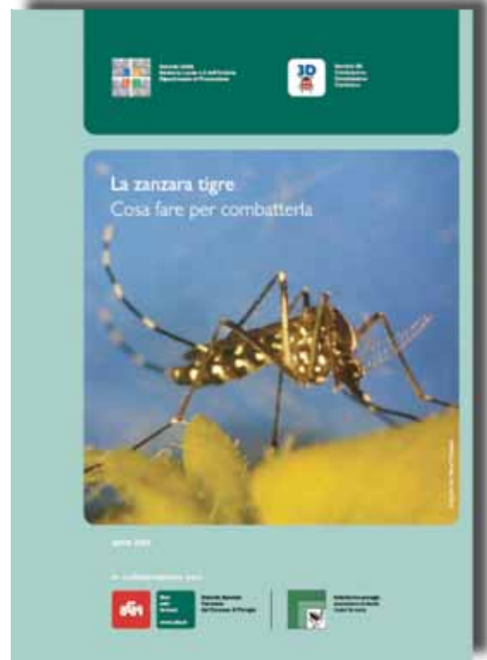
Italiaanse folders om het publiek voor te lichten over de tijgermug.