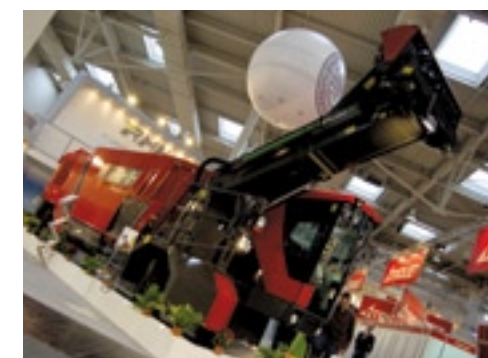
RMH ontwikkelde de nieuwe Mixellent verticaal mengende, zelfrijdende voermengwagen. Er is een 30 kuubs versie leverbaar.

met maximaal 50 omwentelingen per minuut draaien. Vroeger was dat 40 toeren per minuut. Hoe lang en hoe snel de machine moet mengen is met een computer te programmeren. Ook is de nu 65 cm brede elevatorband 15 cm groter geworden. Hij wordt op alle vier wielen aangedreven. Een Deutz-motor zorgt voor het vermogen. De bestuurder houdt de wagen via een computer in de gaten.