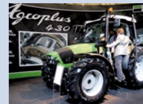
Deutz Fahr's Agroplus 430 TTV.

versnelling is af te lezen. Via verschillende knoppen is het mogelijk in andere schermen te komen. Zo kun je de handleidingen van het scherm lezen of eventuele foutcodes bekijken. Ook handig is de tot in het dak toe doorlopende voorruit. Zo heb je altijd zicht op de voorlader. Het grootste model, de 124 kost 72.000 euro. De productie start in mei. Volgend jaar zal Lindner 300 trekkers uit deze serie bouwen naast de al langer bestaande Geotrac modellen uit de 3-serie. Same Deutz-Fahr toonde een studiemodel van de AgroPlus 430 TTV met variabele transmissie. Deze cvt is door SDF zelf ontworpen in het Italiaanse Treviglio, de eerste in een trekker onder 100 pk. De trekker haalt een topsnelheid