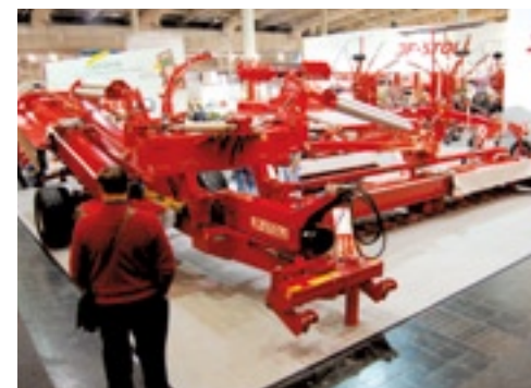
De JF-Stoll GXT15005SM.

twee verticale vijzels komt volgens eigen zeggen van de Israëlische fabrikant RMH. Het bedrijf liet de Mixellent zien. De wagen vangt de oude VS-range. Het topmodel uit die nieuwe serie heeft een inhoud van 30 kuub. De kleinste is 11 kuub groot. Meest opvallend is de cabine die een meter omhoog schuift, zodat de bestuurder meer zicht heeft op de frees als die op zijn laagste punt is. Overigens kan die frees nog voer uit een kuil met een hoogte van 6 meter halen. Haal je er maïs mee uit dan zou je 1,6 ton per minuut uit de kuil kunnen schrapen, meent de fabrikant. De vijzels kunnen