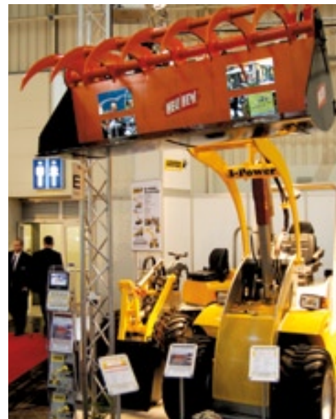
Frank Föckersperger kuilhapper met uitschuifwand.

Bromach, leverancier van Alligator, heeft om grote voermengwagens die zichzelf niet kunnen beladen te vullen, een grote kuilhapper aan het gamma toegevoegd. De drie meter brede happer kost 8.000 euro en neemt in een hap 4 kuub gras mee. De happer die Frank Föckersperger toonde met een inhoud van 0,5 kuub is bedui-