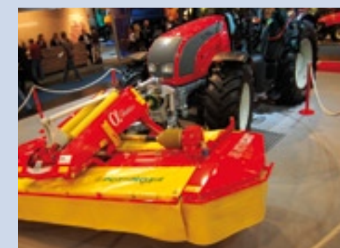
De meesturende fronthead van Valtra.

van 40 km/h. Daarnaast is de trekker uitgerust met een nieuwe cabine met vier stijlen, heeft hij een 4 cilinder 79 kW (108 pk) Deutz-motor en tilt hij 3.600 kg. Valtra toonde twee nieuwe trekkers in de N-serie. De N82 heeft een vermogen van 65 kW (88 pk) en de N92 heeft 75 kW (101 pk) motorvermogen. Meest interessant was echter de nieuwe LHLink. Deze fronthead kan meedraaien, zodra de trekker een bocht maakt. Dat is automatisch mogelijk – waarbij de hef direct of pas bij een bepaalde wieluitslag beweegt – maar ook vanuit de trekkerstoel te regelen. Handig bij het maaïen. Een definitieve versie moet binnen een jaar te koop zijn.