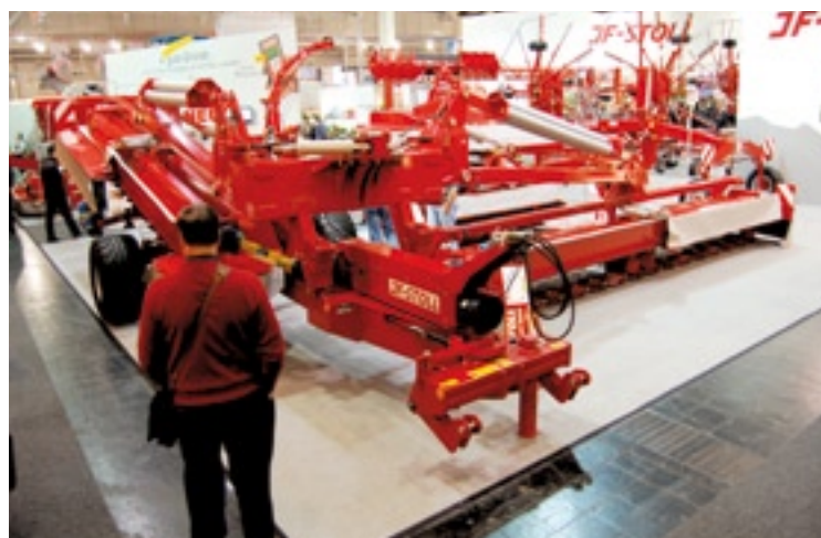
JF-Stoll draadloze afstandsbediening.