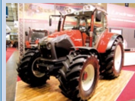
De Lindner Geotrac 124.

Het Oostenrijkse Lindner bracht de nieuwe Geotrac 4-serie naar Hannover. Er zijn drie modellen van 78, 85 en 92 kW (106, 116 en 126 pk). Alle modellen zijn voorzien van een Perkins vier cilinder motor met commonrail en een ZF-versnellingsbak met 24 versnellingen voor- en achteruit. Ze zijn verdeeld over vier groepen met elk drie powershifttrappen. Bij het schakelen tussen de groepen kiest de bak de bij de rij-snelheid passende powershifttrap. Dat spaart brandstof. Verder kent de transmissie geen automatische functies. Opmerkelijk is het beeldscherm dat in het dashboard is te vinden. Daarop is standaard onder meer een digitale toerenteller te vinden, maar ook de gekozen