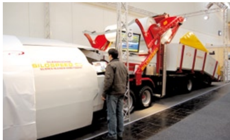
Het Oostenrijkse Silospeed kuilt voer in met een machine en gangbaar plastic op rollen. Er zijn dus geen speciale slurven nodig.