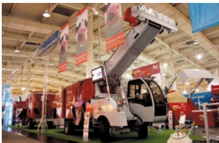
De zelfrijder van BvL; Scorpion 1500.

dend kleiner maar voorzien van een eenvoudig idee dat ervoor zorgt dat de bak altijd helemaal leeg is. De klauw van de happer zit namelijk vast aan de achterwand van de bak. Beweegt de klauw, dan beweegt ook de achterwand en duwt de hele bak leeg. De happer kost 3.000 euro. ■