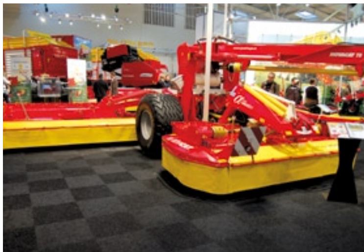
De T8 maaier van Pöttinger.

voer naar achteren waar een invoerwals het onder plastic brengt. Het gewicht van het gewas trekt het naar binnen geslagen plastic strak. Een MAN motor van 280 pk zorgt voor de aandrijving. Volgens de fabrikant kun je zo 600 kuub maïs per uur inkuilen. Het zou goedkoper moeten zijn dan de kuil in een sleufsilos. Je bespaart namelijk op arbeid en beton.