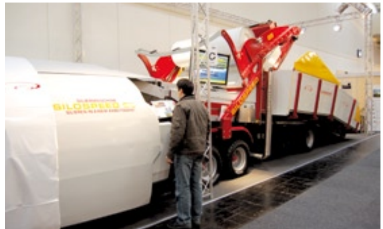
Het Oostenrijkse Silospeed kuilt voer in met een machine en gangbaar plastic op rollen. Er zijn dus geen speciale slurven nodig.