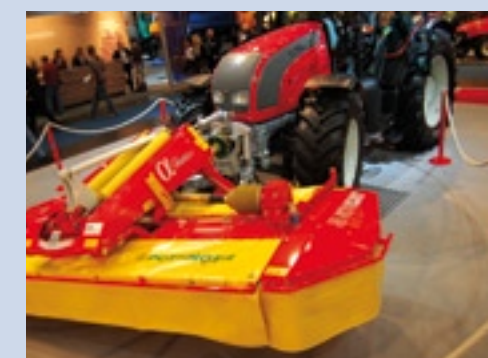
De meesturende fronthead van Valtra.

van 40 km/h. Daarnaast is de trekker uitgerust met een nieuwe cabine met vier stijlen, heeft hij een 4 cilinder 79 kW (108 pk) Deutz-motor en tilt hij 3.600 kg. Valtra toonde twee nieuwe trekkers in de N-serie. De N82 heeft een vermogen van 65 kW (88 pk) en de N92 heeft 75 kW (101 pk) motorvermogen. Meest interessant was echter de nieuwe LHLINK. Deze fronthead kan meedraaien, zodra de trekker een bocht maakt. Dat is automatisch mogelijk – waarbij de hef direct of pas bij een bepaalde wieluitslag beweegt – maar ook vanuit de trekkerstoel te regelen. Handig bij het maaien. Een definitieve versie moet binnen een jaar te koop zijn.