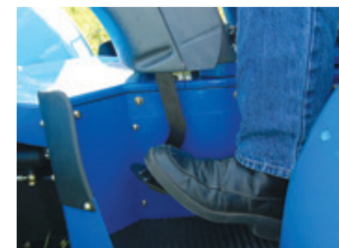
Het koppelingspedaal gaat bijna rechtstandig naar beneden.

Al zittend op de luchtgeveerde stoel is er genoeg ruimte, ook bij de pedalen met grote schoenen. Dit komt deels doordat de trekker iets breder is dan een normale knik. Er moest immers ruimte zijn voor de fuseebesturing. De Volcan 950 RS Dualsteer is met 129 cm breedte 17 cm breder dan een gewone Volcan knik. De koppeling intrappen en de VM viercilinder van 67,5 kW (92 pk) maakt een mooi zacht brommend geluid. Bij het wegrijden na het starten moet je wel eenmalig eerst de rem intrappen om de parkeerrem, Brake-Off, uit te schakelen. De 16/16 versnellingsbak is gesyn-