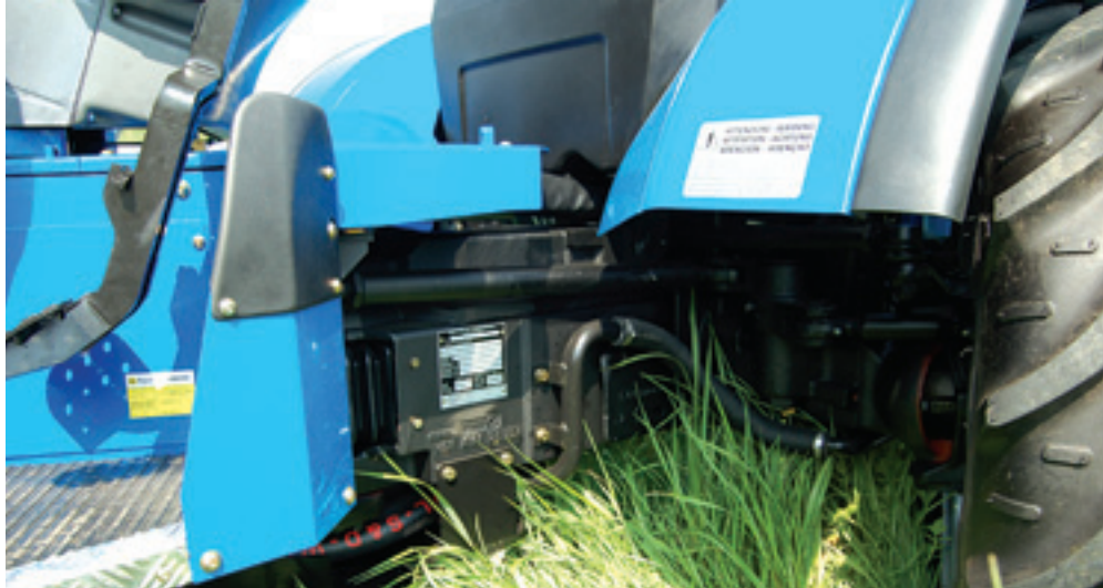
Via een stang is de voorwielbesturing mechanisch verbonden met het centrale knikpunt.

De Volcan bestaat uit drie typen met een viercilinder VM Daimler Benz turbodieselmotor van 47, 61,5 en 67,5 kW (64, 84 en 92 pk). Alle zijn verkrijgbaar met omkeerinrichting, knikstuur en gewoon fuseestuur. Er is alleen een 16/16 bak leverbaar. Wel is er keuze bij de aftakas. Standaard is een 540/750-, optioneel is een 540/1.000-toerenaftakas. De sper op de voor- en achterwielen is onafhankelijk elektrisch hydraulisch in te schakelen. Er is een dubbel hydraulisch systeem met twee onafhankelijke pompen. Voor de hydraulische ventielen is 31 l/min beschikbaar. Standaard zijn drie stuurventielen: twee dubbelwerkende en een enkelwerkend met drukloze retour. Wie wil kan er nog een ventiel bij laten zetten. De hef met dubbele hefcilinders is uit te voeren met trekkrachtpositieregeling. Handig om bijvoorbeeld een spuit of strooier mooi vlak op dezelfde hoogte te houden. Het topmodel, de Volcan 950 RS Dualsteer, is te koop vanaf 42.200 euro (catalogusprijs). Zonder Dualsteer is de trekker 2.300 euro goedkoper. De kleinste met 28 pk's minder, de Volcan 750, is er vanaf 35.600. Voor wie droog of koel in de zomer wil zitten, is er een luxe cabine met dakraam leverbaar voor bijna 6.000 euro. ■