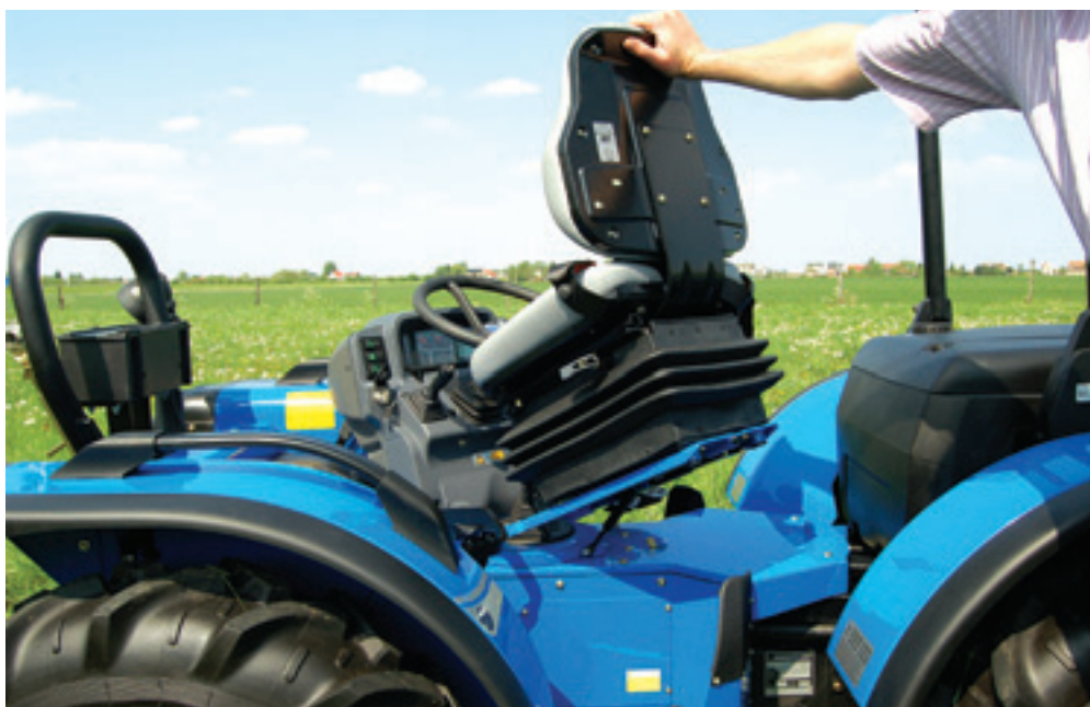
De gehele stuurinrichting is eenvoudig om te draaien; handig detail is een gasdemper die helpt om de stoel omhoog te houden tijdens het omkeren.