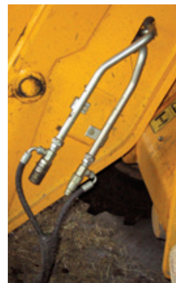
Een dubbelwerkend hydrauliekventiel aan de kop van de giek is standaard.