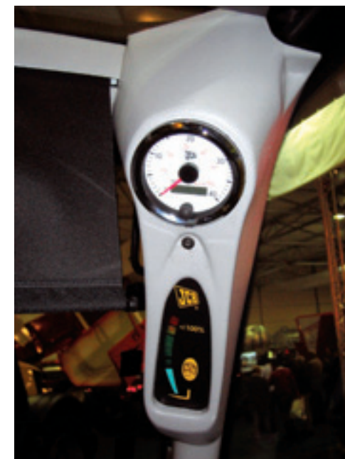
Lampjes en geluid op ooghoogte waar schuwen voor stabiliteitsgevaar.