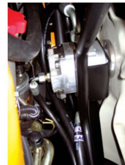
De uitvoering met omkeerventilator is hydraulisch aangedreven.