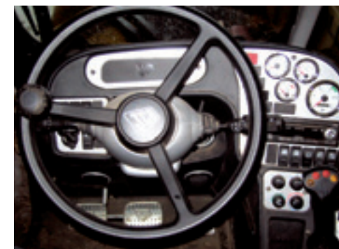
De luxe ruime cabine doet met wit ingelegde wijzerplaten en verchromde ringen on-Engels aan.

JCB levert acht typen verreikers in speciale Farm Special uitvoeringen. Deze zijn qua uitrustingsniveau weer onderverdeeld in de Plus en Super. De Plus uitvoering heeft een 28 km/h viertraps JCB powershift met omkeer. Bij optionele uitschakeling van de vierwielaandrijving is de maximum snelheid 32 km/h. Uitschakeling van de vierwielaandrijving spaart banden en brandstof bij transport. De Super uitvoering heeft een 40 km/h JCB vijftraps powershift met omkeer (4 versnellingen),