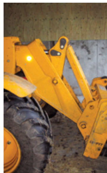
De kop van de giek vormt een stuk met het laatste giekdeel.