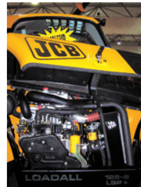
De nieuwe JCB Farm Special verreikers zijn nu uitgerust met een eigen JCB motor.

ventiel. Wanneer je een lading uit het veld gaat halen, zal je al gauw over die 10 ton heen zitten. Het is niet echt duidelijk hoe de fabrikant hiermee omgaat. Het moet volgens hun geen probleem zijn, maar door dit te bewijzen zouden ze gewoon af fabriek een zwaardere trekhaak moeten monteren, zoals andere verreiker fabrikanten dit doen. De besturing bestaat uit voorwielbesturing, vierwielbesturing en hondengang met gepatenteerd automatische recht zetten van de wielen. Bij voorwielbesturing is er achter dubbellucht te monteren. De wielkasten laten van voren geen dubbellucht toe. De bodemvrijheid onder de cabine verschilt per type van 40 tot 46 cm. Concurrenten gaan tot 56,5 cm en maken gebruik van portaalassen. De cabinehoogte is voor alle typen 2,49 meter en de breedte 2,30 meter. De Farm Special uitvoeringen zijn leverbaar met een hefvermogen van 3.000, 3.500 en 4.000 kg en reikwijdtes van 6,2 en 7,0 m. Andere hefvermogens en reikwijdtes zijn echter buiten de Farm Special serie ruim voorhanden binnen het JCB programma. De overlap tussen de giekdelen is meer dan een meter om er voor te zorgen dat de giek niet vervormd. De kop van de giek is uit een stuk gemaakt en vormt dus een geheel met het laatste giekdeel.