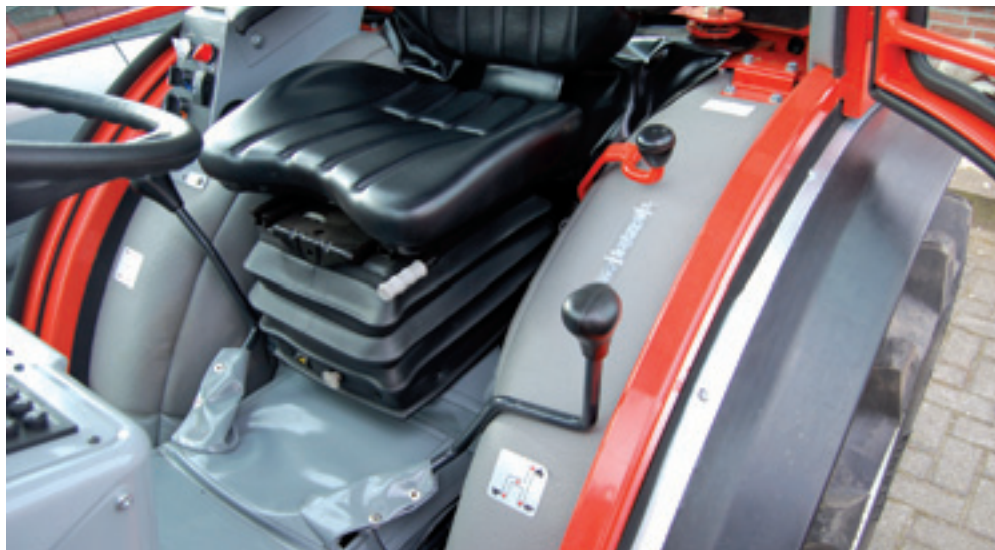
De schakelhendels zijn netjes naar de beide zijkanten weggewerkt. De hendel voor de drie groepen zit links, waar ook de aftakasinschakeling zit. De hendel met vier versnellingen zit aan de rechterkant. Daar zit bij dit model ook de mechanische regelblok voor de hydrauliek en hef.