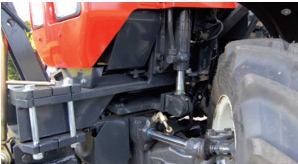
Nieuwste optie op een Krieger smalspoortrekker: een geveerde vooras. Werking is via een hydraulische cilinder, compact weggewerkt.