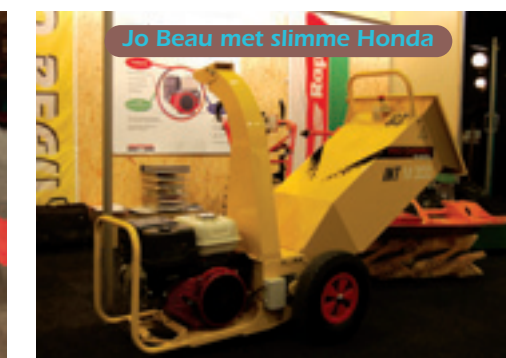
Jo Beau met slimme Honda

Bij Van der Klugt Groentechniek stond de Beau Int M300 hakselaar heeft de nieuwe slimme Honda IGX 440 motor van 15 pk. Op deze een-cilinder zit een regelunit waarbij je het toeren-tal kunt regelen afhankelijk van de belasting. Dit gaat via een laptop. Wanneer er dus hout (max. 9 cm diameter) in de versnipperaar zit, verhoogt de motor het toerental en bij geen belasting gaat hij automatisch terug naar stationair. Dit scheelt brandstof en lawaai. De prijs is 6.375 euro excl. BTW. ■