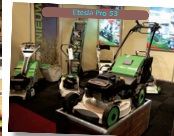
Etesia Pro 53

lende uitvoeringen, van een eenvoudige die werkt op de hydrauliek van het voertuig tot een aftakasaangedreven met eigen hydrau-lijk, olietank en ventielen. De PA35 is er vanaf 5.800 euro.