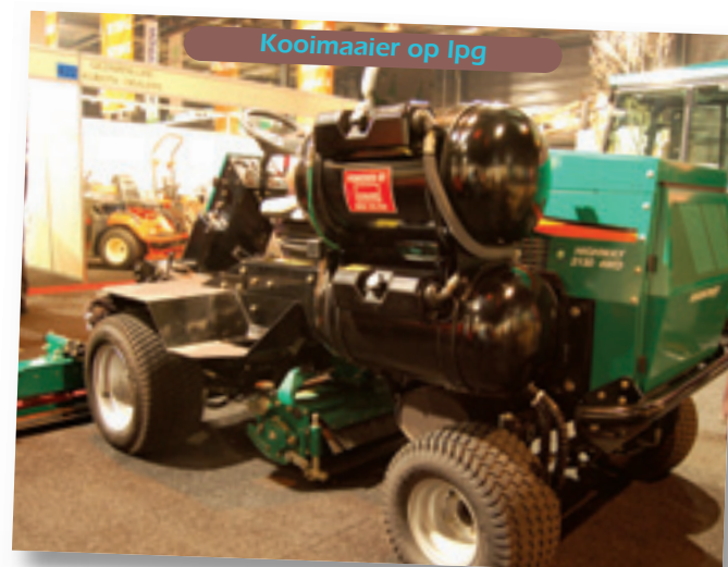
Kooimaaiër op lpg

■ LPG Er lopen genoeg auto's op lpg, dus waarom niet een kooimaaiër. Uit milieuoverwegingen zou dit toch moeten. Pols Zuidland toonde een driedelige Ransomes Highway kooimaaiër met Ford motor op lpg. Aan de zijkant zitten twee grote gastanks. Voor het milieu en de portemonnee is het beter. Nadeeltje is dat je meer moet tanken en eventueel de opslag van lpg.