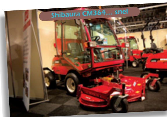
Shibaura CM364... snel