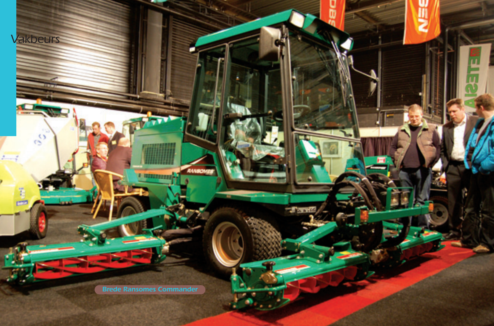
Brede Ransomes Commander