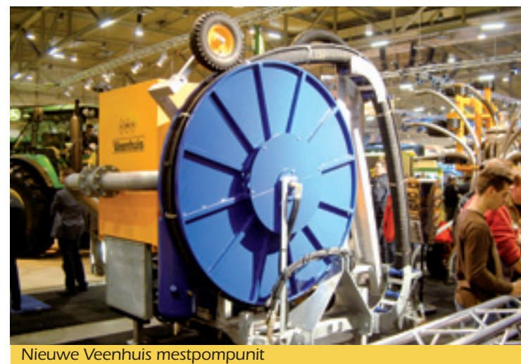
Nieuwe Veenhuis mestpompunit