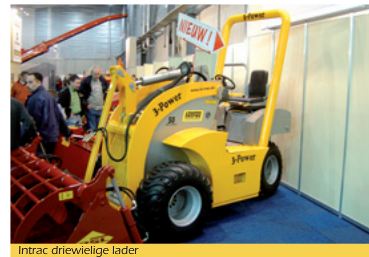
Intrac driewielige lader