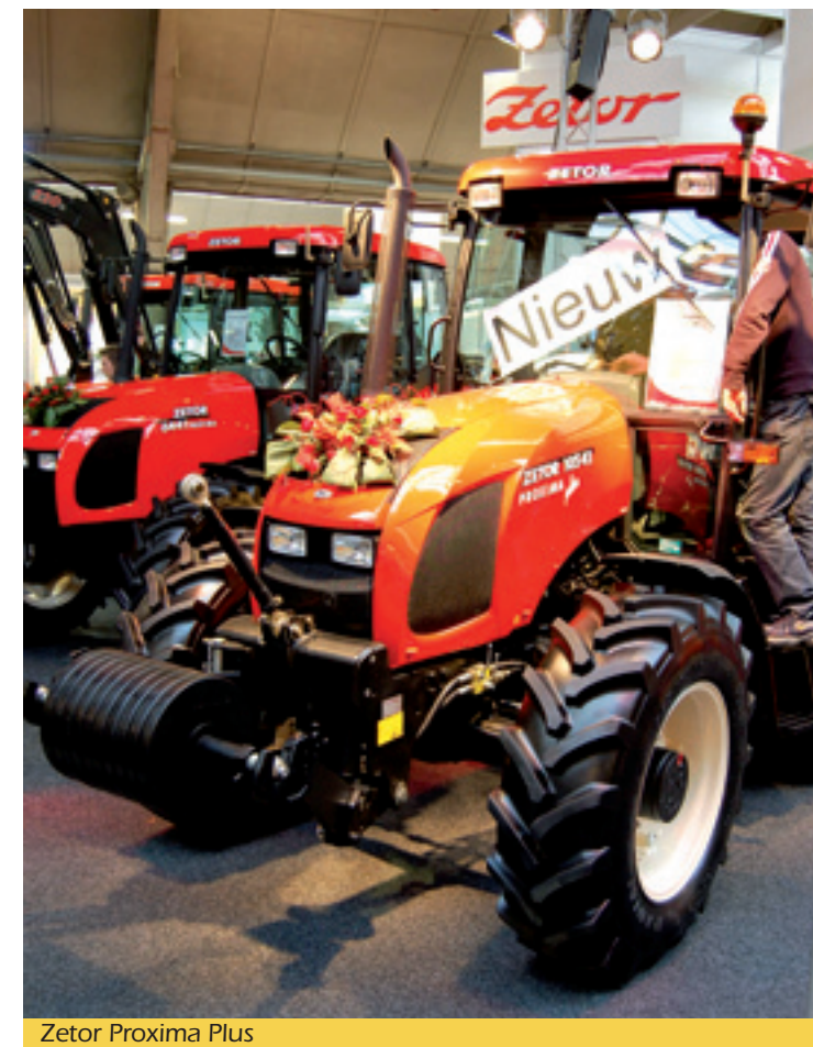
Zetor Proxima Plus

Bij importeur Slootsmid was voor het eerst de Zetor Proxima Plus te bewonderen. Plus betekent dat je met de meest luxe Proxima te maken hebt die je kunt krijgen. Slootsmid lanceerde het idee en de Zetor fabriek nam het over. Wat je ervoor krijgt? Een nieuwe 16/16 transmissie met een hi-lo, digitaal dashboard, geen aparte koppeling meer voor de aftakas, drie dubbelwerkende ventielen en een gesynchroniseerde omkeerhendel. Bovendien kun je kiezen uit een aftakastoeentalcombinatie van 540/540 E of 540 E /1000. Opvallend is de inschakeling van de 4WD en de sperddifferentieel, die werken pneumatisch.