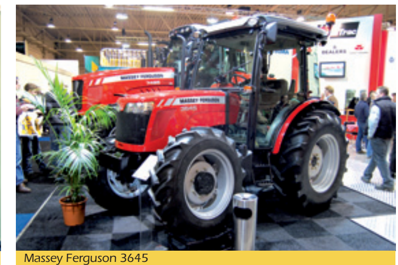
Massey Ferguson 3645