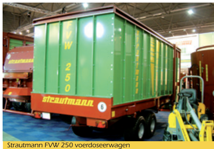
Strautmann FVW 250 voerdoseerwagen

Lastig hè, wanneer de zuigarm van je mesttank te kort is om over de silowand te komen? Je zult dan toch moeten uitstappen om een slang aan de vaste aansluiting te koppelen. Niet met het silozuigstation van Kemp uit Houten. Het is een aanzuigtrechter op een karretje die is aangesloten op de silo. Aanzuigtrechters bestaan langer maar niet voor silo's en je moet er redelijk precies voor sturen. Door het karretje kun je de aanzuigtrechter met de zuigarm naar je toe trekken. Duw de trechter met de zuigarm in en een klep gaat open zodat de mest komt. Het karretje dient tegelijk als lekbak. Kemp is bezig om deze bak automatisch weer leeg te laten zuigen. Het station kan gemakkelijk achter een quad of in de driepunt van de trekker worden meegenomen. ■