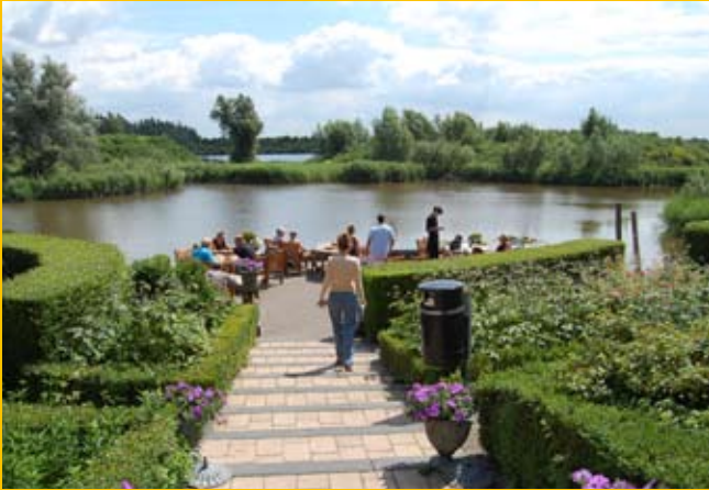
De Aalscholver met terras aan het water achter het restaurant. Bezoekers kunnen te voet, met de fiets of met een waterfiets of bootje het achterliggende natuurgebied verkennen.