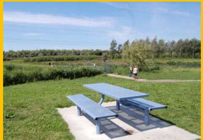
De Lepelaar, toegang tot het achterliggende natuurgebied.