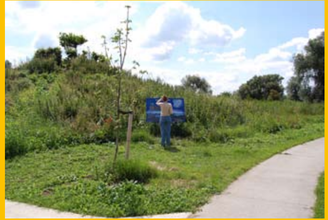
Informatiebord over fauna en flora in het natuurgebied.