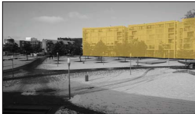
Ruimteform: een duidelijke begrenzing van de ruimte