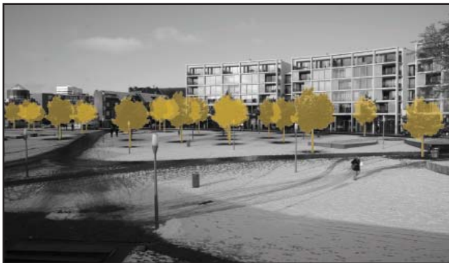
Verschijningsvorm: groen op het stationsplein, versterkt de wand