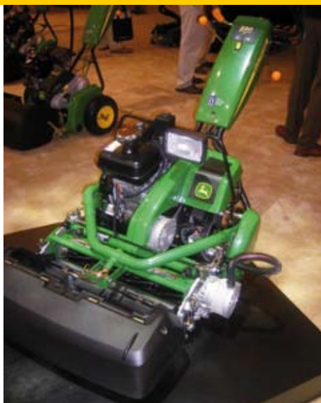
John Deere 220 E-cut Hybrid

Toro liet een aantal spannende prototypes zien die volgende jaar of in 2011 op de markt komen. Eén driedelige hybride triplex-maaier was zo geheim dat geen foto's gemaakt mochten worden. Ook spannend was een nieuwe elektrische handgreenmaaier met een veertienbladige maaicilinder. Deze handgreenmaaier, de FLEX 21, gaat werken met Lithium-batterijen voor extra capaciteit. Het grote aantal messen van de kooi zou moeten zorgen voor extra afsnijdingen per meter en daardoor een betere balrol.