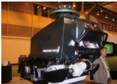
Volautomatisch maaien met de Precise Path

Niet van de 'grote merken' maar wel innovatief is er nieuws van Precise Path. Dit is een robot handgreenmaaier die, zodra deze eenmaal is ingesteld, de green volautomatisch kan maaien. Volgens de leverancier kan één man vier machines aansturen. In de tussentijd kan de greenkeeper bunkers harken en de hole verzetten.