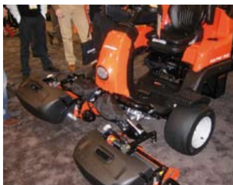
Jacobsen 322 triple eclips

Jacobsen stal in 2009 letterlijk de show met de 322 triple eclips. Een geheel elektrische triplex waarbij het aantal afsnijdingen van de snijcilinders totaal onafhankelijk en traploos in te stellen is. Het accupakket zou toereikend voor 18 holes. Met een groomer kunnen ongeveer dertien holes achter elkaar worden gemaaid.