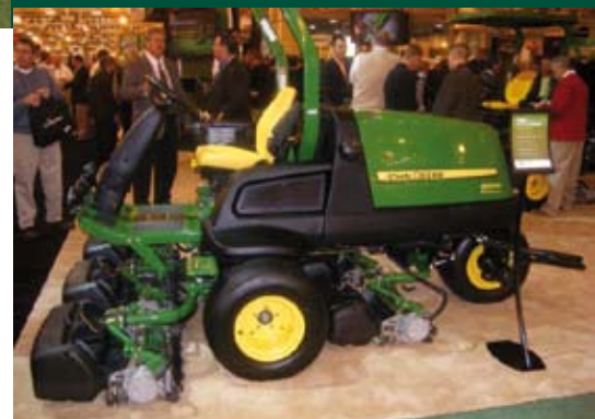
John Deere 8000 E-cut Hybrid

John Deere liet het nodige zien op gebied van hybrides. De John Deere 8000 E-cut Hybrid is een 3-wielige 5-delige fairwaymaaier met kleine kooien voor een nog strakker maaibeeld door betere bodemvolging van de kleine maaieunits. De units worden elektrisch aangedreven. De John Deere 7500/8500 E-cut hybrid is de 4-wielige fairwaymaaier waarbij de maaieunits ook elektrisch worden aangedreven via een generator.