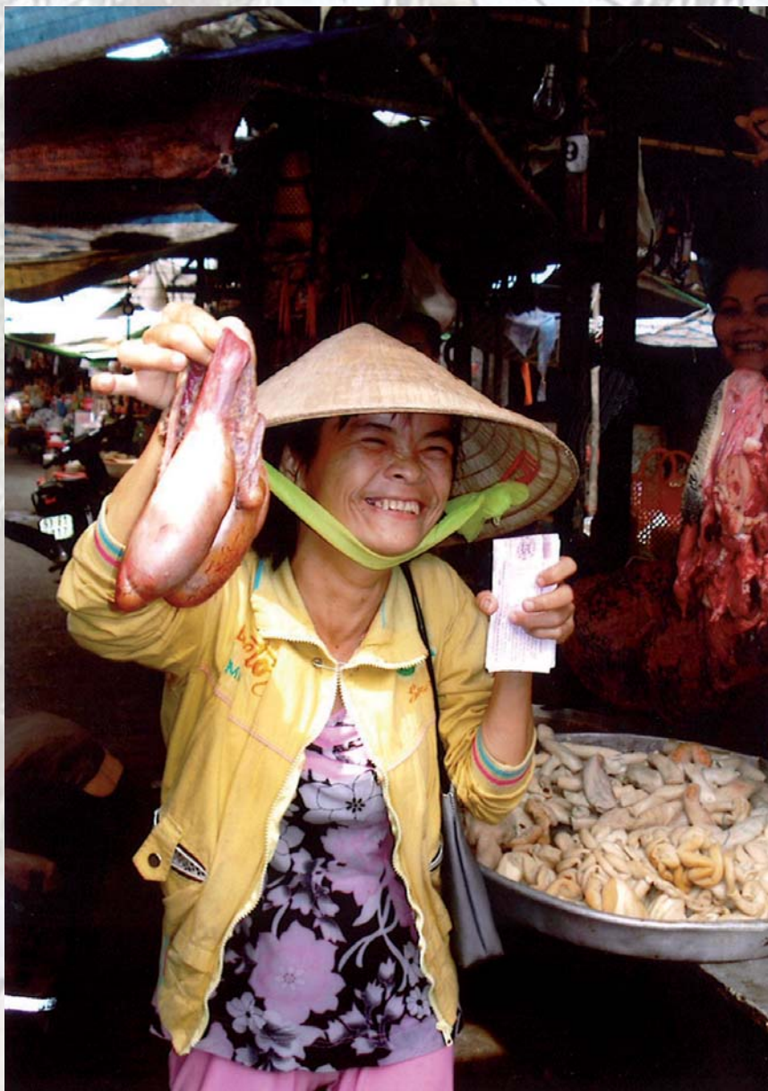
Op de markten, langs de straten en ook langs de wegen in het buitengebied is in stalletjes vlees te koop, zelfs koeienkoppen en poten!

Met de zuivelindustrie is het overigens nog maar zeer matig gesteld. Zo werd in 2005 nog maar 102.000 ton melk geproduceerd, slechts 20 procent van de landelijke consumptie. De invoer van zuivelproducten is daardoor zeer groot, onder andere vanuit Nederland. De zuivelproducten van de concerns Friesland Foods en Campina zijn dan ook goed vertegenwoordigd in de Vietnamese