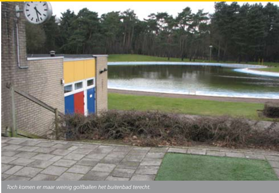
Toch komen er maar weinig golfballen het buitenbad terecht.

gebruiken is er uiteindelijk een 18-holes baan ontstaan. Hierdoor is er voor recreatieve wedstrijden met veel golfers meer ruimte.”