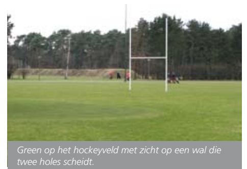
Green op het hockeyveld met zicht op een wal die twee holes scheidt.

moesten we meestal - tijdelijk - andere greens maken. Nogal ingrijpend was de aanleg van het derde kunstgrashockeyveld en het nieuwe hoofdveld voor de voetbalvereniging. Dat laatste zorgde voor een drastische aanpassing van de golfbaan. Een halfverhard terrein hebben we in twee holes veranderd. De lava van de toplaag hebben we op een heuvel midden over het veld gelegd en die vormt nu een middenscheiding tussen twee holes. Tegelijkertijd creëerden we hiermee ook de enige twee 'echte' fairways die we hier hebben. Op de ligweide en rondom het buitenzwembad hebben we in augustus 2005 drie holes aangelegd. Die zijn buiten het zwemseizoen vanaf 1 september tot 30 april in gebruik. Doordat we ook drie holes op de driving range en putting green plus nog drie (tijdelijke) holes op de sportvelden kunnen