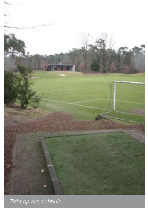
Zicht op het clubhuis.