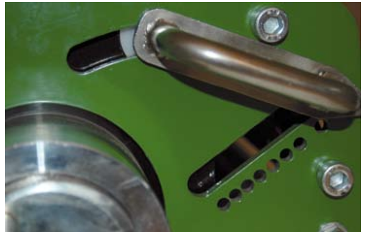
Vibrating Roller: met een stevig stelizer gemakkelijk de werkdiepte kiezen.

twee gewichtjes die met een spindel verplaatsbaar zijn. Daarmee maak je de as in tien standen meer of minder excentrisch. Volgens de leverancier brengt de Vibrating Roller de trilling op een bijzondere en milde manier over op het greenoppervlak en treedt er geen verdichting op. Dat komt omdat de werking anders is dan een trilplaat voor het aantrillen van een zandbed.