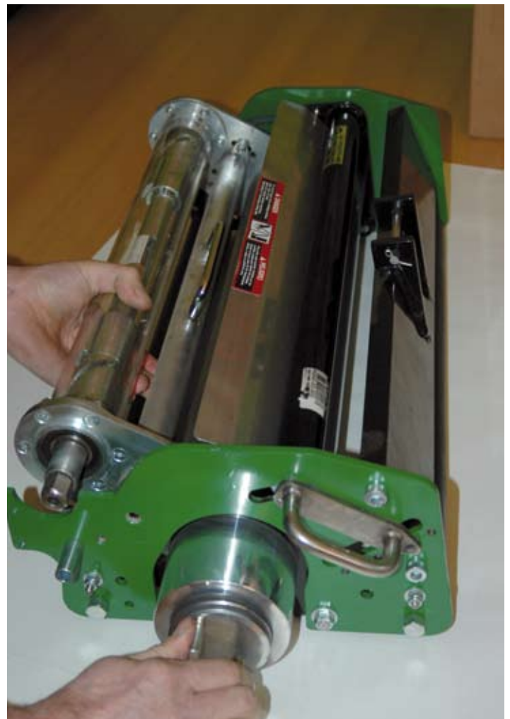
Dankzij een grote snelspanmoer kan de Vibrating Roller snel gewisseld worden.