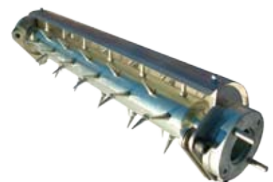
De Sarel Roller van Pols.

Het ontwikkelde montagesysteem maakt het mogelijk cassettesystemen voor de greenmaaiers in enkele minuten te wisselen. Snel wisselen is één, het snel en eenvoudig kunnen afstellen van de werkdiepte is vele malen belangrijker. De cassettes kennen geen stelizer, maar een draaiknop. De werkdiepte instellen of aanpassen tijdens het werk is mogelijk zonder demontage van de units. De modulaire Turfworks-units zijn leverbaar voor de drie gangbare greenmaaiers op de Nederlandse markt; de prijzen verschillen enkele procenten. Achteraf is het altijd mogelijk een set aan te passen voor een ander type greenmaaiers. De units bestaan altijd uit een frame en de benodigde aanbouwdelen en kunnen daarna met diverse cassettes gecombineerd worden. Turfworks units kunnen volgens de leverancier als enige worden geleverd met zowel een cassette voor verticaal maaien als de trilrol-functie. Deze combinatie is tot ruim 30 procent goedkoper dan conventionele systemen.