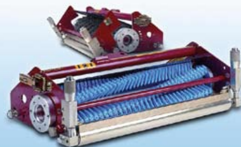
Het Thatch-Away SUPA-(cassette)systeem van DBS.