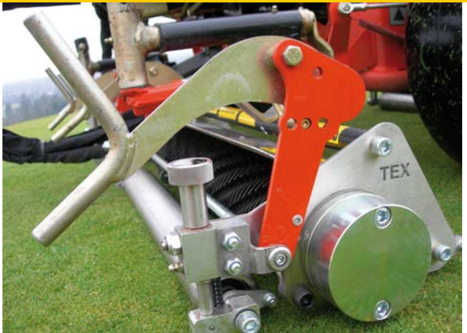
Werkdiepte met de draaiknop instellen.

tussenafstand is de Ultra Grooma ook geschikt om de zaadkopjes van straatgras te verwijderen. Zo'n bewerking is bijzonder effectief bij nieuw ingezaaide greens om inzaai van straatgras te voorkomen.