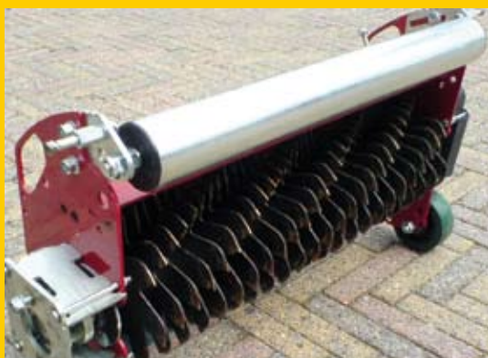
Verticuteerunit van Maredo.