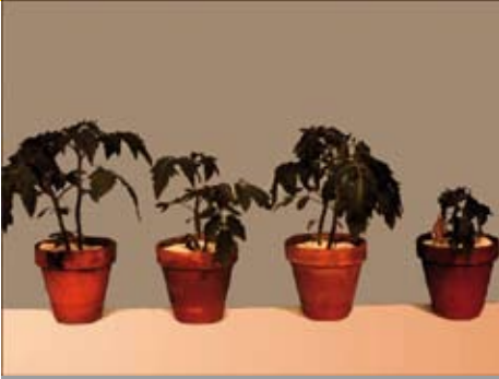
Interactie van Meloidogyne en Fusarium oxysporum f. lycopersici op tomaat; v.l.n.r.: vrij, nematode, schimmel en nematode+schimmel.

dringt binnen en reproduceert binnenin zich. Hoewel de geïnfecteerde nematode gedurende dit proces in leven blijft, gaat zijn pathogeniciteit, kracht en vruchtbaarheid sterk naar beneden.