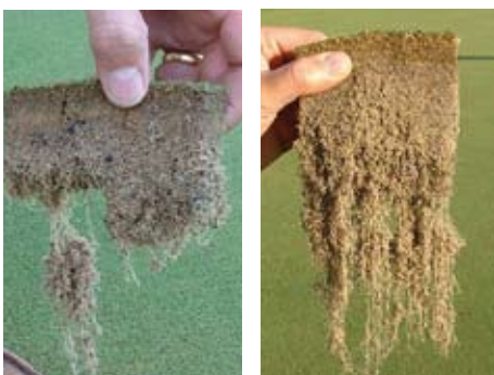
Links geïnfecteerd wortelsysteem, rechts een wortelsysteem niet-geïnfecteerd met Meloidogyne minor

2005. Op de website van ODIN'59, een Nederlandse amateurvoetbalvereniging uit Heemskerk, wordt het bericht verspreid dat verschillende Heemskerkse sportvelden besmet zijn met aaltjes. De doorworteling is enorm gereduceerd, waar-