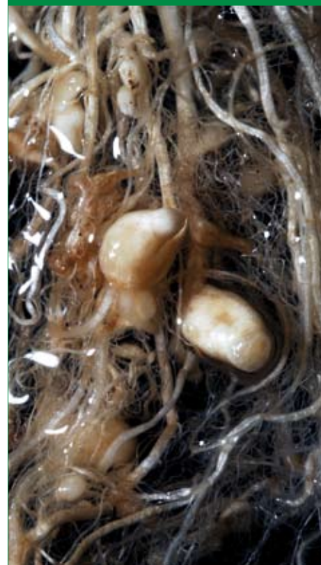
Nematoden in wortels.

Een volledige versie van dit artikel inclusief literatuurlijst vindt u in het archief van de website www.greenkeeper.nl