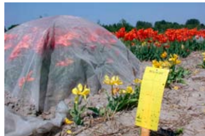
Proefopstelling voor het bestuderen van het vluchtgedrag van bladluizen en de verspreiding van tulpenmozaïekvirus in een proefveld

Het verloop van TBV-verspreiding en de ernst van deze verspreiding is gedurende twee