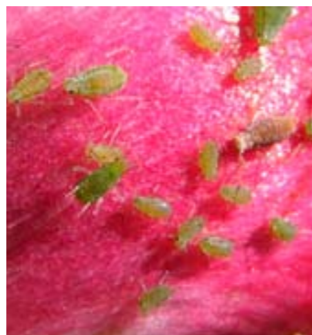
Bladluizen op een tulpenbloem

groting van bedrijven waardoor er minder tijd en expertise beschikbaar is voor het ziek zoeken. Ook de slechte of in de tijd zeer beperkte zichtbaarheid van symptomen (typerend voor gele en witte cultivars) en mogelijk de grotere vatbaarheid van bepaalde cultivars voor TBV is een reden.