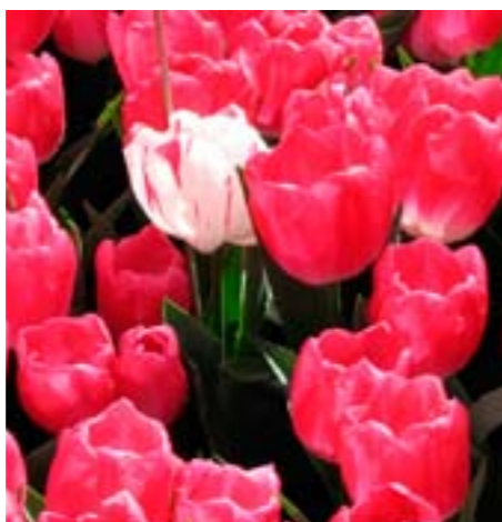
Karakteristieke symptomen veroorzaakt door tulpenmozaïekvirus

Tulpenmozaïekvirus (In het Engels: Tulip Breaking Virus, TBV) behoort tot de familie van de potyvirusen, virussen die door bladluizen of andere insecten worden overgebracht. Vooral in de gele (en witte) tulpen cultivars is het virus moeilijk onder controle te krijgen. Het virus veroorzaakt directe schade zoals opbrengstverlies en kwaliteitsverlies door virussymptomen. Daarnaast is er indirecte schade, veroorzaakt door de beheersingsmaatregelen en verplichte keuringsmaatregelen. Percentages TBV van 6 en hoger, waarbij virusbeheersing vrijwel onmogelijk is geworden, zijn helaas geen uitzondering meer. Dit heeft onder meer te maken met de schaalver-