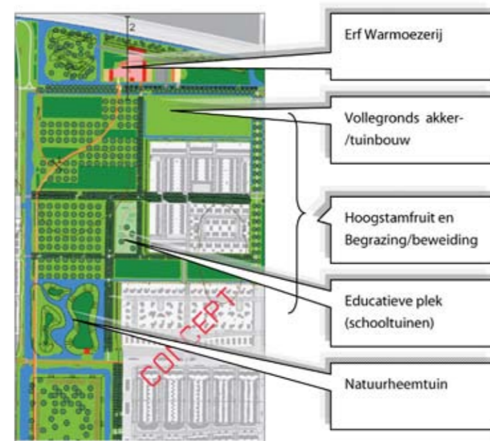
Eerste idee ruimtelijke indeling Warmoezerij (DSO Almere, juni 2009)

Het gebied wordt doorkruisd door de rode loper . In verband met de begrazing is het zinvol deze voor een groot deel in te rasteren. Overigens heeft deze rode loper vanuit het functioneren van de Warmoezerij geen toegevoegde waarde en is het benutten van de bestaande lanenstructuur voor de bereikbaarheid voldoende.