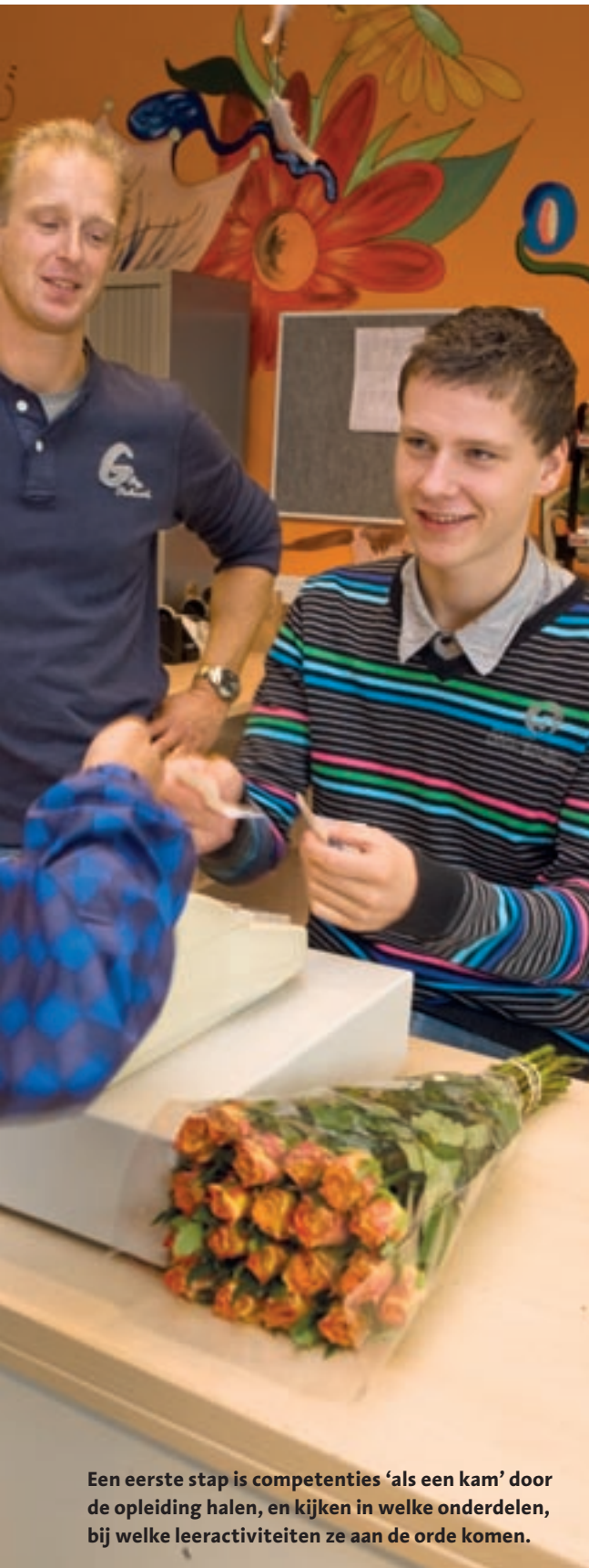
Een eerste stap is competenties 'als een kam' door de opleiding halen, en kijken in welke onderdelen, bij welke leeractiviteiten ze aan de orde komen.