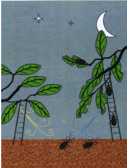
Figuur 4. Kevers worden aangetrokken door de uitgescheiden geurstoffen van Euonymus sp. en hebben een voorkeur voor aangevreten planten. Adult weevils are attracted to the odour of Euonymus sp. and have a preference for weevil-damaged plants.