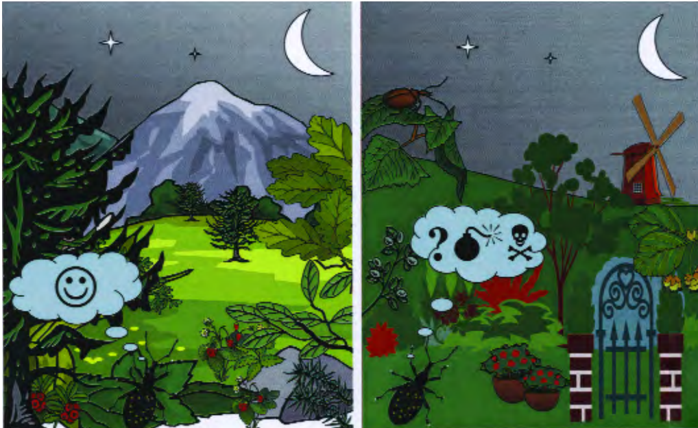
Figuur 6. Vleugelloze kevers van het geslacht Otiorhynchus hebben eeuwenlang geïsoleerd geleefd in de Alpenregio. Bekend met de smaken en geuren van planten en dieren aldaar worden zij in hun nieuwe leefomgeving op het verkeerde been gezet. The flightless weevil species of Otiorhynchus have been living isolated in the Alps for ages. Familiar with the taste and odours of plants and animals in these habitats the weevils show a mismatch in response in relation to reproduction and survival in their new habitats.

kevers zowel op waardplanten als op beschadigde niet-waardplanten. Vraag is nog of deze aggregatie alleen veroorzaakt wordt door de geur van de plant of dat er een aggregatieferomoon een rol bij speelt.