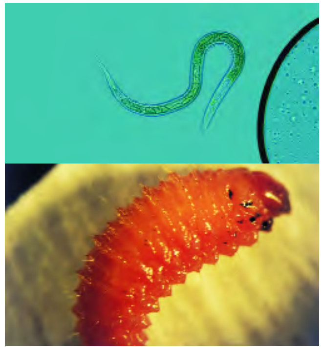
Figuur 3. Het insectenparasitaire aaltje Heterorhabditis megidis (boven) en een door dit aaltje geïnfecteerde larve van de taxuskever (onder), oranje verkleurd door de bacterie Photorhabdus sp. die in symbiose leeft met het aaltje en de dood van het insect veroorzaakt.

The entomopathogenic nematode Heterorhabditis megidis (top) and a vine weevil larva infested by this nematode (down), coloured orange due to the nematodes' symbiotic bacterium Photorhabdus sp. which kills the grub.