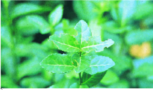
Figuur 2. Kenmerkende halfronde hapjes uit de bladrand van Euonymus fortunei , veroorzaakt door de taxuskever. Typical notching pattern on the leaves of Euonymus fortunei caused by the vine weevil.

band ziet tussen de kever die op warme zomeravonden op het terras tegen de muren oploopt en de plantensterfte door de larven. Dat komt overigens niet alleen doordat zowel larven als kevers een verscholen bestaan leiden, maar ook doordat de kever slechts één generatiecyclus per jaar doorloopt. De planten sterven door de larvenvraat pas af in de winter en het vroege voorjaar als de kevers allang verdwenen zijn.