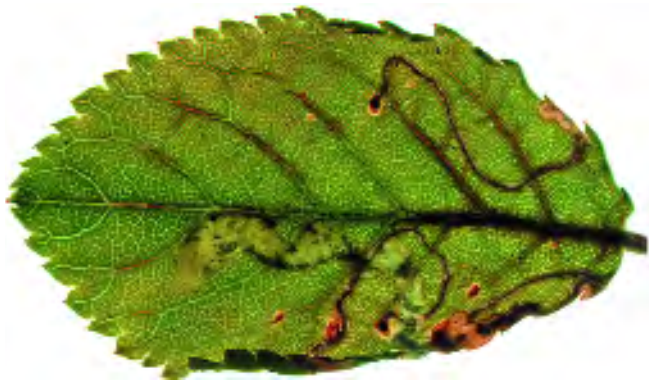
Figuur 2 a, b. Lyonetia prunifoliella : ovipositielittekens en gangmijnen, enkele al voortgezet in een kleine blaasmijn.

Lyonetia prunifoliella : oviposition scars and corridor mines, some already widening into a small blotch.