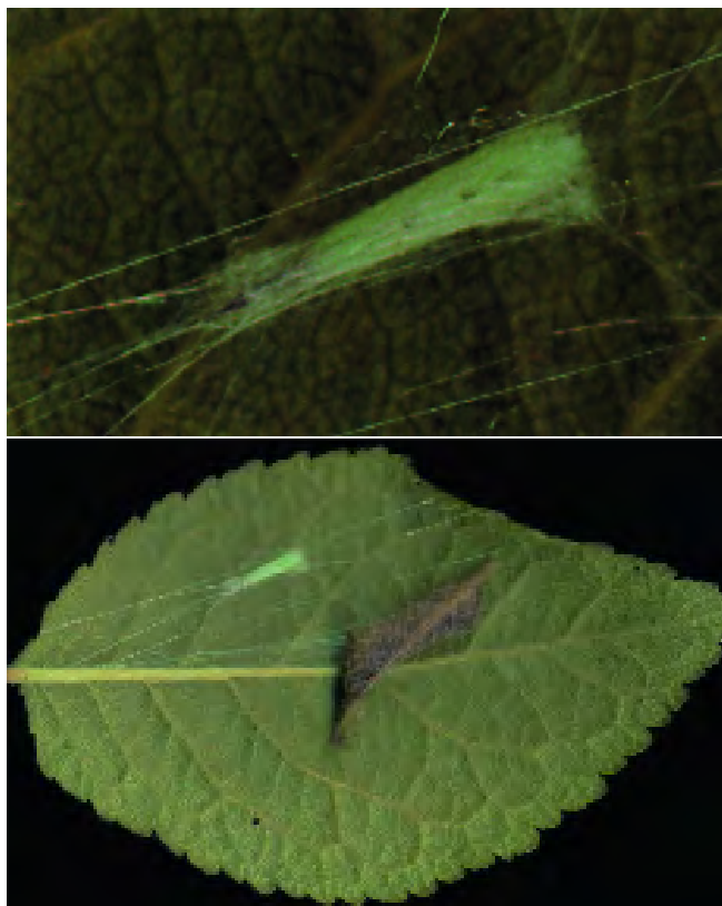
Figuur 4a, b. Lyonetia prunifoliella -cocoon, als een hangmatje opgehangen aan lange spinseldraden onder een blad. Een afgevallen verdord blad is in het spinsel blijven hangen.

De schadelijkheid van de 'apple leaf-miner' in Noord-Amerika is nog maar van betrekkelijk korte datum (Schmitt et al. 1996, Thornton 2003). De boven genoemde voorkeur voor jonge bladeren maakt dat vooral jonge scheuten en pas ingeplante of te zwaar bemeste boomgaarden worden aangetast. Aantallen van tot zestig mijnen per blad worden genoemd. Dit leidt tot afsterven van het resterende blaasweefsel en uiteindelijk tot bladval. Het is niet uit te sluiten dat L. prunifoliella ook in Nederland een schadelijk insect wordt. Op het internet zijn echter zoveel artikelen te vinden over het feromoon van deze soort dat de bestrijding geen groot probleem kan zijn.