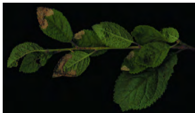
Figuur 1. Sleedoorntakje met blaasmijnen van Lyonetia prunifoliella . Sloe twig with blotch mines of Lyonetia prunifoliella .

De ruilverkaveling heeft niet alleen tot nieuwe natuur geleid, ook zijn er singels hersteld, kolken (poelen) gegraven en is het beekdal van de Heidenhoeksche Vloed min of meer hersteld. Dat inspireerde weer diverse bewoners tot de aanleg van erfscheidingen door middel van struiken. Zo ook de eigenaar van het perceel waar L. prunifoliella gevonden werd. Hij plantte drie jaren geleden allerlei struiken in de singel waaronder een dertigtal sleedoorns. Deze werden gekocht bij een lokale tuinderij die op zijn beurt het bosplantsoen in Zundert kocht. Wie weet is L. prunifoliella ook daar te vinden. De bewuste sleedoorns zijn nu manshoge struiken die rijkelijk vrucht dragen.