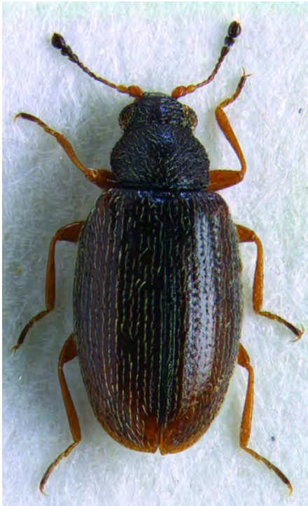
Figuur 1. Kevers van het geslacht Melanophthalma zijn niet eenvoudig tot op soort te determineren. Vrouw-tje Melanophthalma suturalis , Naardermeer, 6 mei 2004, leg. Oscar Vorst. Beetles of the genus Melanophthalma are not easy to identify. Female Melanophthalma suturalis, Naardermeer, Noord-Holland, 6 May 2004, leg. Oscar Vorst.