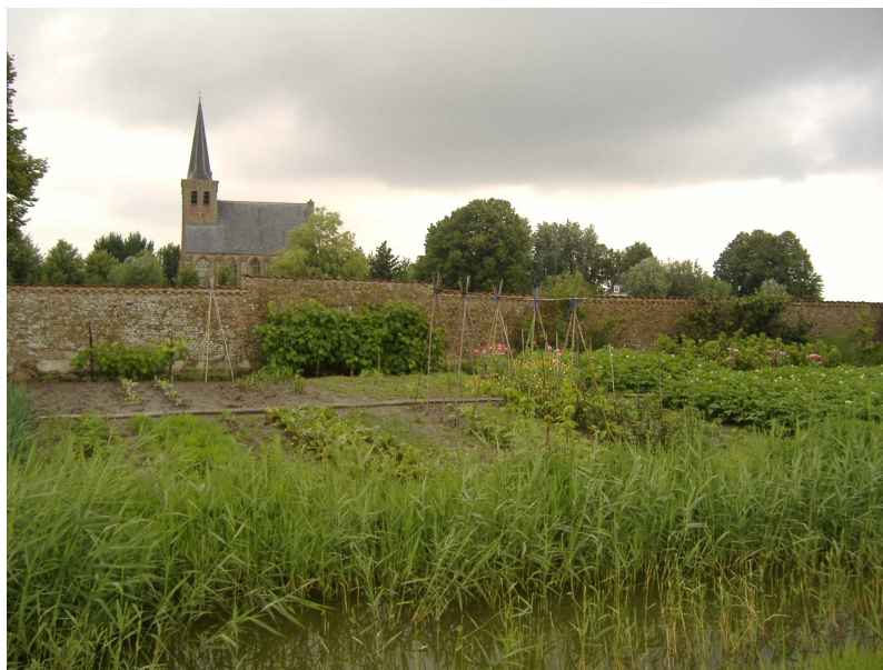
Figuur 2: Voorbeeld van een goed inpassing van microlandbouw in het landschap.

Naast differentiatie op het regionale schaalniveau in een Poelzone, Midden-Delfland en het nieuw in te richten gebied rond Pijnacker en Berkel-Rodenrijs is een integrale aanpak nodig op het lokale niveau van samenhangende projecten zoals de inrichting van de Oranjevuitenpolder, de aanleg van de Poelzone, het beheer van de open veenweidegebieden en de aanleg van waterbergingsbassins. Integraliteit impliceert een intensieve speurtocht naar meervoudig gebruik van de ruimte, bijvoorbeeld voor waterbeheer, veeteelt, cultuurhistorie, warmteberging en zorgfuncties. Integraliteit is gediend met het zoeken naar onconventionele combinaties van functies en partners. Het vraagt om passende publieke en publiek-private arrangementen.